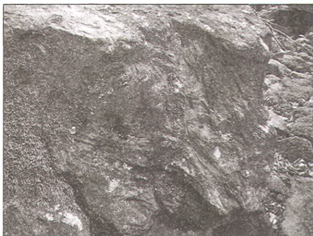
5. В некоторых случаях на плитах дольменов можно увидеть явные следы растекания раствора. Как, например, на этом снимке покровной плиты дольмена в районе горы Цыганова, п. Пшада.