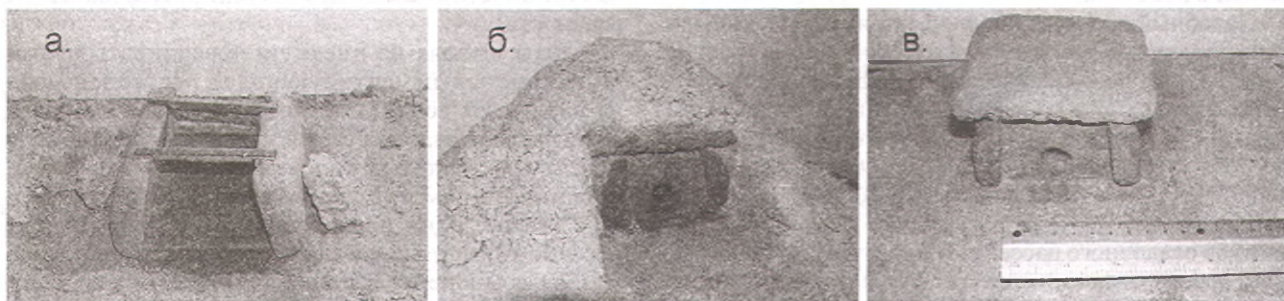
Р и с. 12. Изготовление модели дольмена (М 1:20) из песчано-глинистой массы (пояснения в тексте).

мень). Затем, прямо на пяточном камне залил будущие боковые стенки. Боковые стенки опираю на распорки, наклоня навстречу друг к другу под небольшим углом. Снаружи боковые стенки подпираю «необработанными скальными обломками» — контрфорсами (рис. 12а). Используя засыпку из песка, сформировал опалубку для фронтальной и задней стенки. В отверстие во фронтальной плите вставил закладную (дольменная втулка). По завершении заливки фронтальной и задней плиты-стенки весь дольмен оказался погребенным под земляным «курганом-опалубкой». Вершину кургана-опалубки я выровнял и на нее залил плитую-крышу. После затвердевания раствора отрыл фронт дольмена, удалил дольменную втулку и через отверстие удалил землю (рис. 12 б). Вот что получилось (М 1:20). Прообраз — дольмен на отрогах горы Цыганова (Пшада) (рис. 12 в). На мой взгляд, представленная гипотеза не только дает объяснение технологии строительства дольменов в начале бронзового века, но и имеет немало тому подтверждений, наблюдать которые может любой посетивший эти мегалитические памятники.