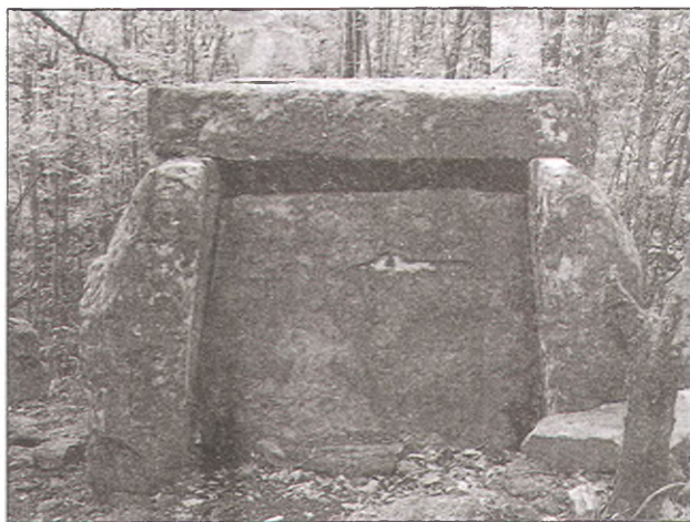
6. Боковые плиты плиточных дольменов (92% всех дольменов плиточные) имеют на разрезе характерную линзовидную форму с выпуклостью наружу. Внутренняя поверхность формировалась на ровном каменном полу дольмена, на котором производили заливку, п. Пшада. Отроги горы Цыганова.