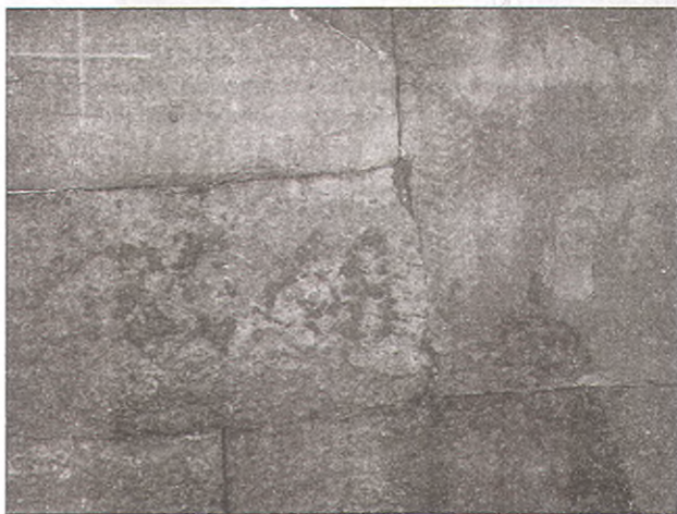
8. Качество стыковки многотонных каменных блоков в составных дольменах можно объяснить только формированием этих блоков в пластичном состоянии. Стыковочные швы криволинейные, но блоки сопоставлены абсолютно точно, г. Нэксис.

При осмотре и изучении дольмена нужно помнить о том, что плиты за прошедшие тысячелетия подвергались различным эрозивным процессам (про воздействие человека я даже не говорю), и именно поэтому указанные мною признаки видны не на всех дольменах. Иногда эрозивные процессы придают каменным блокам совершенно дикий и бесформенный вид. Но два-три признака можно найти