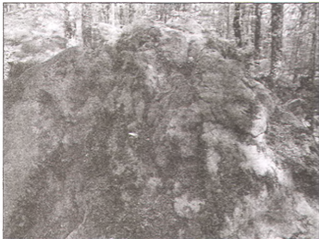
Р и с. 10. Глыба песчаника со следами пластичных подтеков. Район ст. Шапсугской.