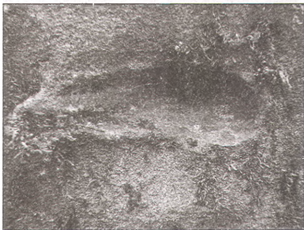
7. При внимательном осмотре плит дольмена можно увидеть самые разнообразные артефакты. На фото — фрагмент плиты дольмена с углублением, оставленным в пластичном растворе, например, палкой. Восьмидольмене, п. Пшада.