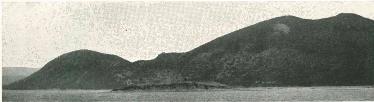
Мысъ Утришь съ часто-перемѣннымъ огнемъ на SO 89° въ разстояніи 1/2 мили.