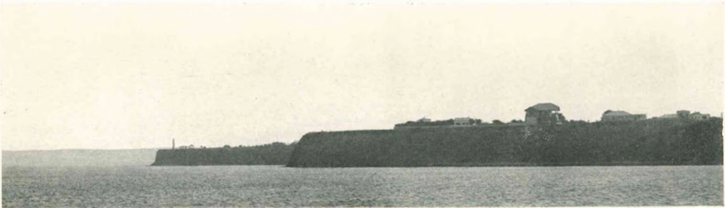
Анапскій мысъ съ башнею (временной бѣлый огонь) на NO 73° въ разстояніи 1/2 мили.