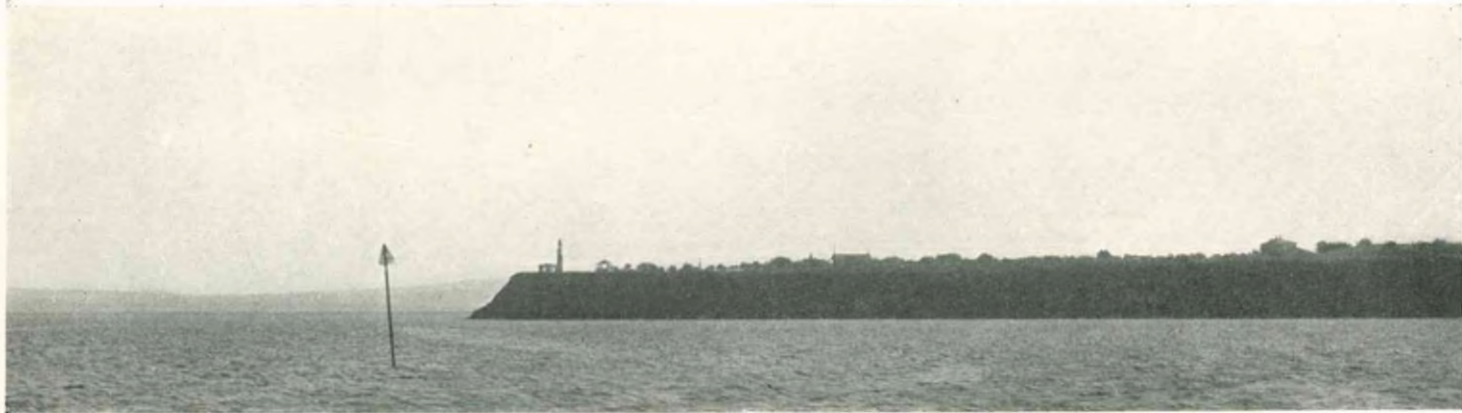
Сѣверный Анапскій мысъ съ башнею (временной бѣлый огонь) на SO 56° въ разстояніи 1/2 мили.