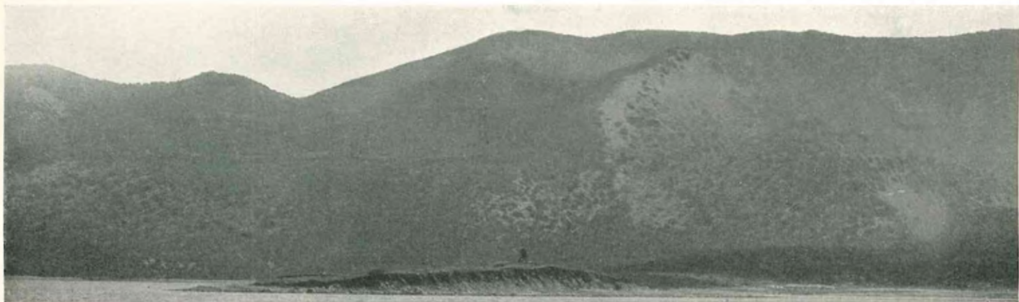
Мысъ Утришь съ часто-перемѣннымъ огнемъ на NO 34° въ разстояніи 1/2 мили.