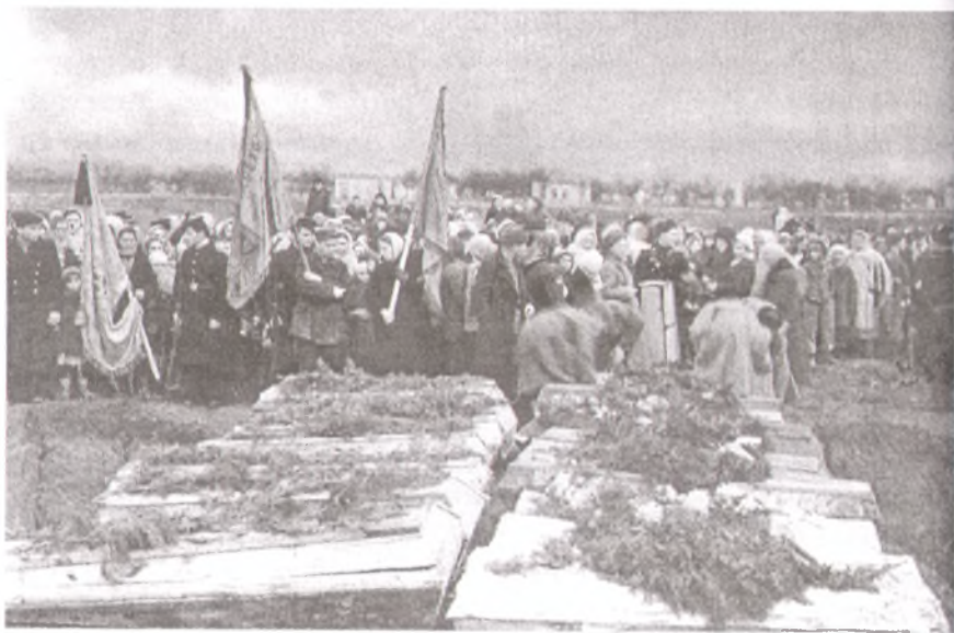
Перезахоронение советских людей, расстрелянных немецкими оккупантами. Анапа, 1943 г.

К исходу 24 сентября 89-я и 414-я дивизии, сломив сопротивление противника, вышли на южный берег р. Гостагайка, восточнее Витязевского лимана. 81-я бригада овладела Витязевом, 242-я дивизия 56 армии — Гостагаевской, а 26