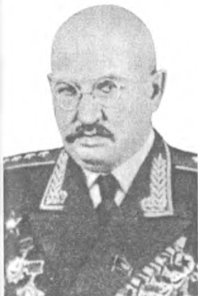
И. Е. Петров