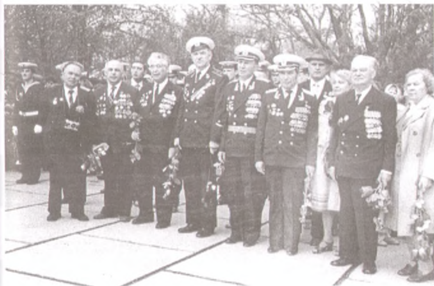
Ветераны 11-ой штурмовой авиадивизии на встрече 9 мая 1987 г. г. Анапа