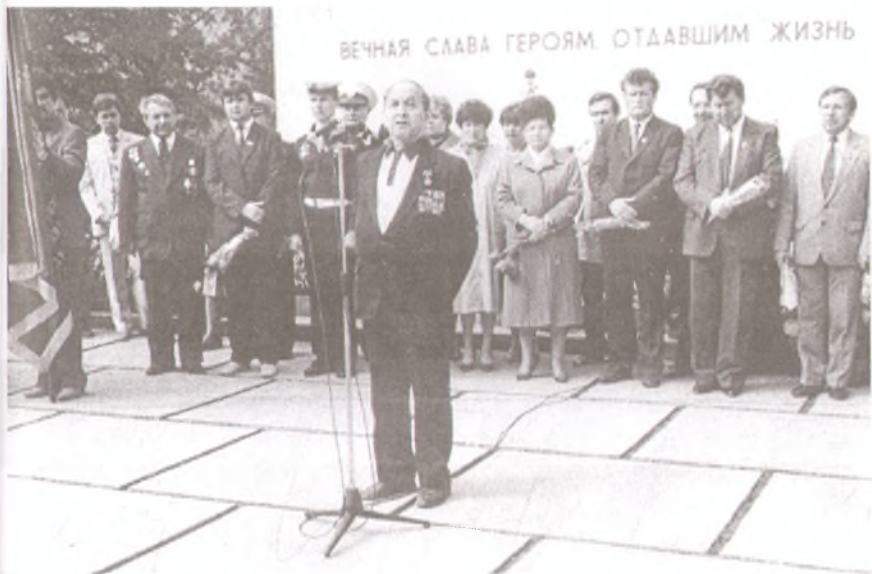
Выступает бывший командир 8 гв. штурмового авиаполка Герой Советского Союза М. Е. Ефимов, Анапа, 9 мая 1987 г.