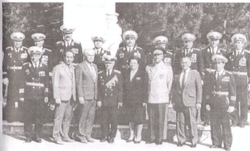
Ветераны 7 ИАП в моршколе, 9 мая 1991 г., г. Анапа