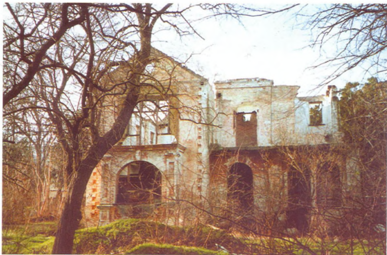
Сегодня эта дача выглядит так