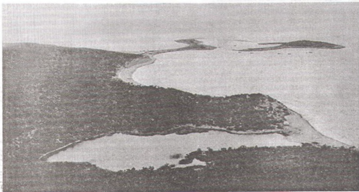
Анапа-Сукко. Остров Ультришь, 1911 г.