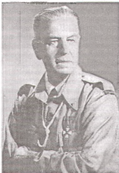
Старший русский скаут и основатель русского скаутского движения полк. О.И. Пантюхов

Для поддержания старых казачьих традиций всей Кубанской организации скаутов дается старинное казачье название "Громада". Вводится как высшая награда звание "Атаманский скаут". Под редакцией Э.П. Цитовича издается книга "Русский скаут". В мае 1919 г. в г. Армавире проводится слет кубанской "Громады". Слет возглавлял прибывший в Армавир Э.П. Цитович.