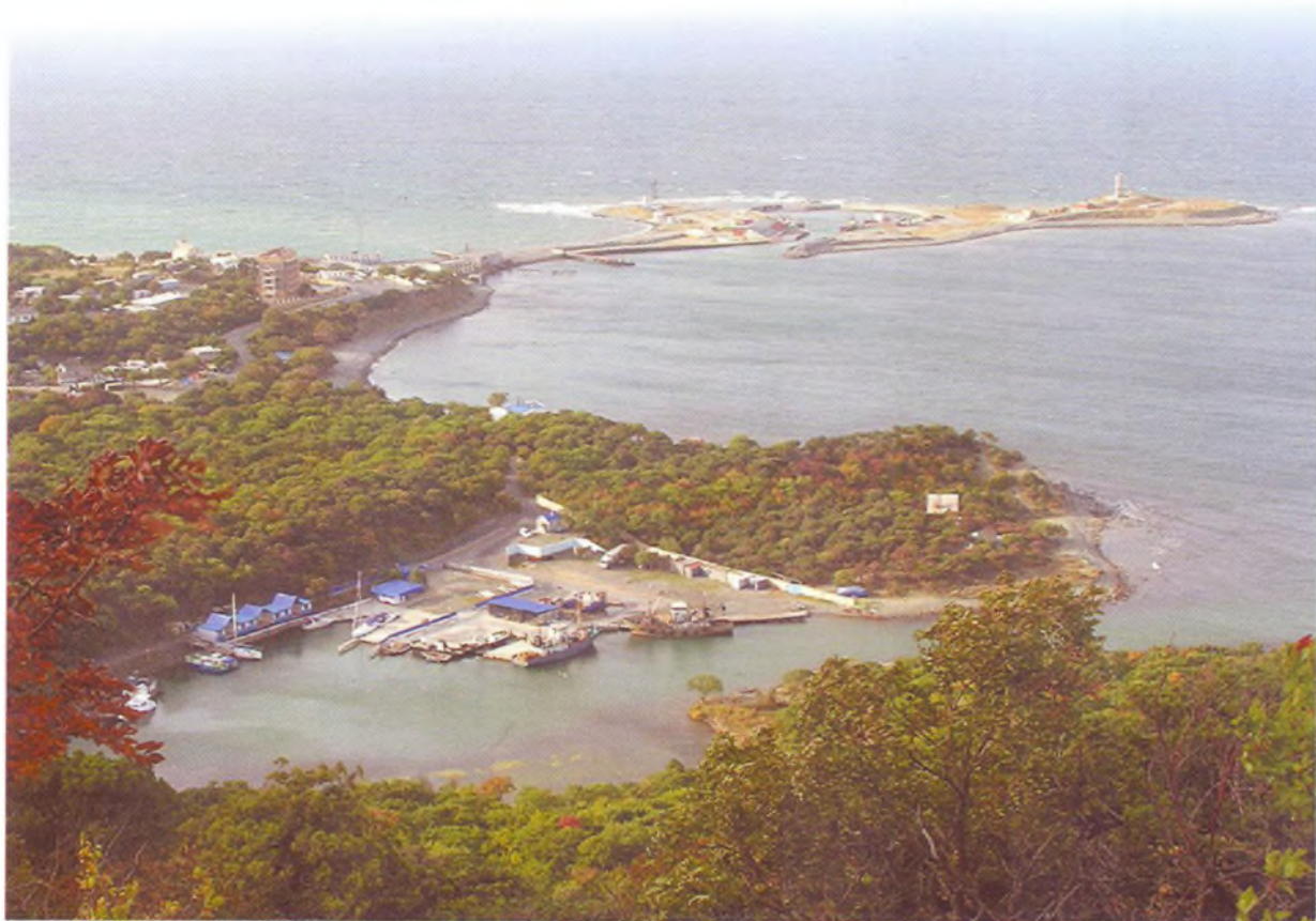
Большой Утриш, 2004 г.