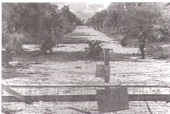
1943 г. Размещение улиц Анапы.