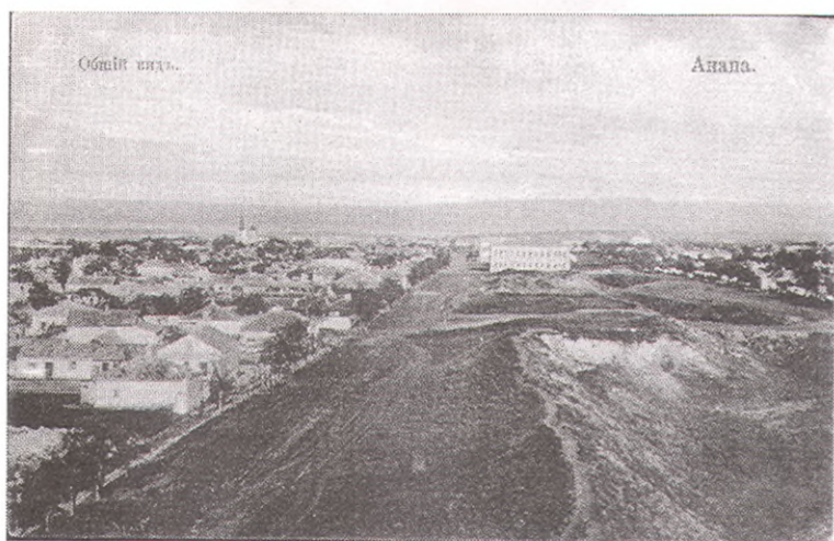
Анапа. Вид на улицу Крепостную. Остатки крепостного вала и рва. (Начало XX века).

С началом русско-турецкой войны 1828-1829 гг. Перовский формирует Таманский отряд численностью 1000 человек. Задача отряда - поддержать высадку десанта Черноморского флота при штурме Анапы. После начала штурма В.А.Перовский назначается начальником штаба всех сухопутных войск под Анапой. Анапа взята. Войска перебрасываются под крепость Варну. Здесь Перовский получает тяжелое ране-