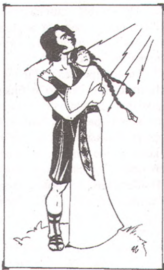
Прометей и черкешенка. Рис. О.Коробенкова (1999 г.)-

только небо задрожало в предчувствии беды.