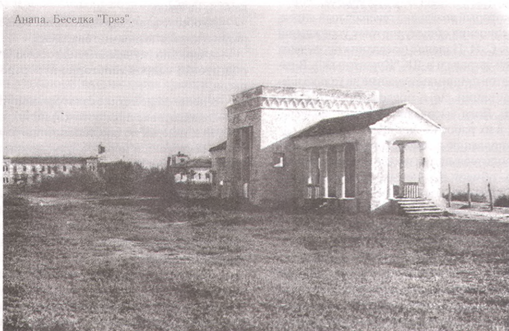
Анапа. Набережная. Беседка «Грез» (начало XX века).