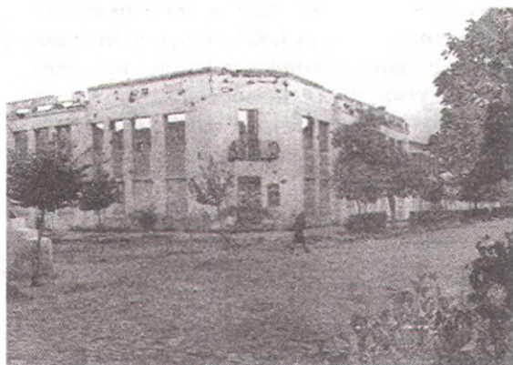
Здание Госбанка. (Улицы Пушкина и Тираспольская)