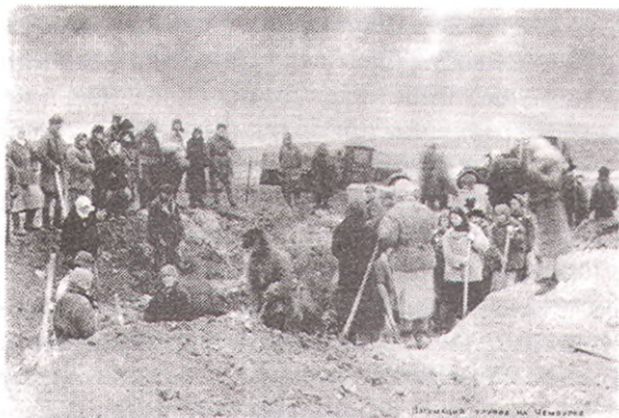
1943 г. Эксгумация трупов на Чембурке.

сентября советские войска освободили Новороссийск. Первая линия обороны фашистов на южном участке Голубой линии была прорвана. Гитлеровцы стали поспешно отступать в направлении Анапы, чтобы спасти живую силу и технику. Используя сильно пересеченную местность Анапского района, организовав промежуточные оборонительные рубежи, заняв выгодные позиции на высотах, фашисты приготвоились к обороне Анапы.