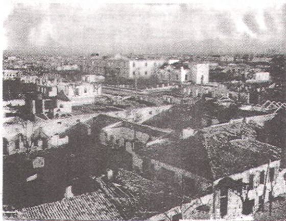
(1946 г.) Разрушенная Анапа со стороны Греческой. (Ныне примерно от санатория «Кубань»)

В результате многодневных ожесточенных боев, сломив упорное сопротивление врага, 16