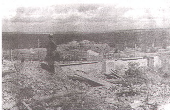
1943 г. Вид разрушенного анапского морпорта.