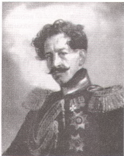
В.А.Перовский. 1837 г.

верситета в гвардию. Отечественная война 1812 г. круто изменила жизнь как России, так и Василия Перовского. Он участвует в Бородинском сражении, ранен, при отступлении к Москве был взят в плен французами, шел в колонне пленных до Парижа, хороня павших товарищей. После взятия Парижа русскими войсками вернулся в армию. С 1818 года Перовский - адъютант великого князя Николая Павловича. Впереди его ждала блестящая карьера. Он дружил с Пушкиным и Жуковским.