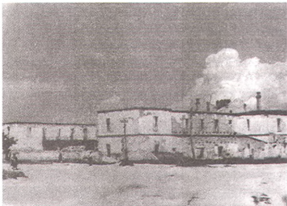
Разрушенные здания санатория «Красная звезда».

В сентябре 1942 г. группа разведчиков-моряков в количестве 19 человек под руководством политрука К. Диброва высаживается в районе между с. Сукко и Варваровкой. Цель и задачи: разведать охрану побережья, зафиксировать расположение огневых точек противника и систему укреплений, найти безопасный район для подхода наших кораблей к высадке десанта. Разведчики засекли огневые точки, зафиксировали укрепления. Но по пути возвращения к условному месту, где их должны были снять наши катера, враг устроил засаду. Завязался бой. Одержав победу, разведчики все же не смогли продвинуться к условленному месту. Пришлось уйти в горы. Отряд был обнаружен нашими разведчиками и снят катерами лишь 3 ноября 1942 года, т.е. через 33 дня после высадки. Позже К. Дибров со своей группой участвовал в десанте Ц. Куникова, высаживался на Эльтиген. За проявленное мужество, храбрость и отвагу К. Диброву присвоено высокое звание Героя Советского Союза.