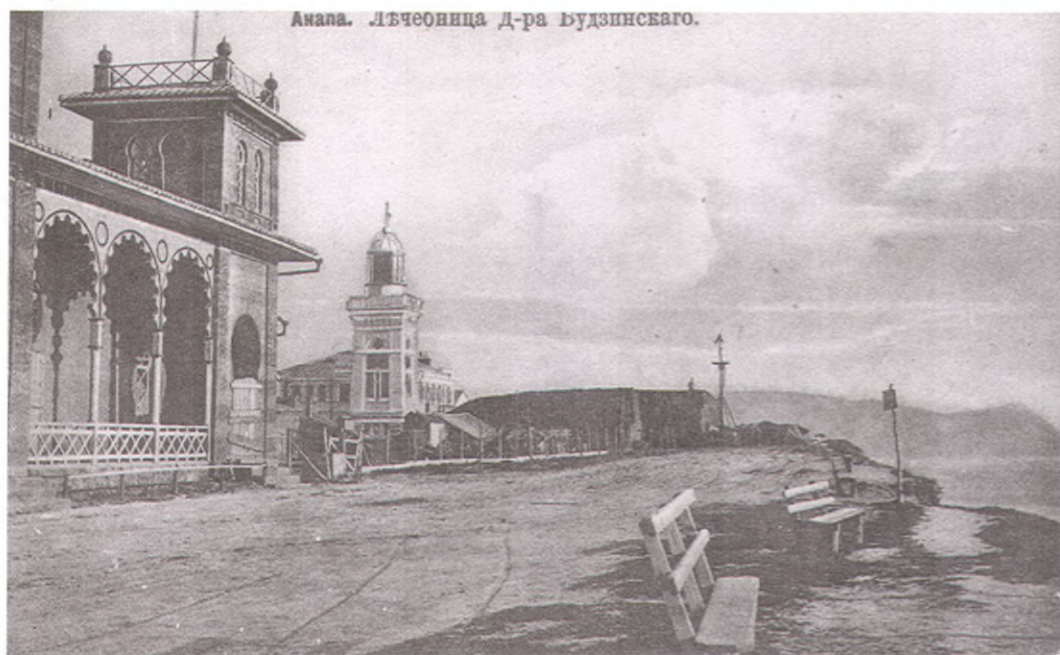
Лечебница д-ра Будзинского