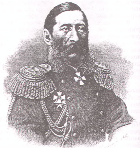
Граф М. Т. Лорис-Меликов

рядом с Сукко, в 2-х км, и имеет высоту в 150 м. Это скала на Большом Утрише. Она расположена на изгибе горы так, что видна с моря именно со всех сторон. Здесь много веков страдал Прометей за то, что дал огонь людям. И Богу было угодно, чтобы в конце прошлого столетия у этой скалы вспыхнул маяк как символ прометеевского огня, освещающая путь людям и кораблям.