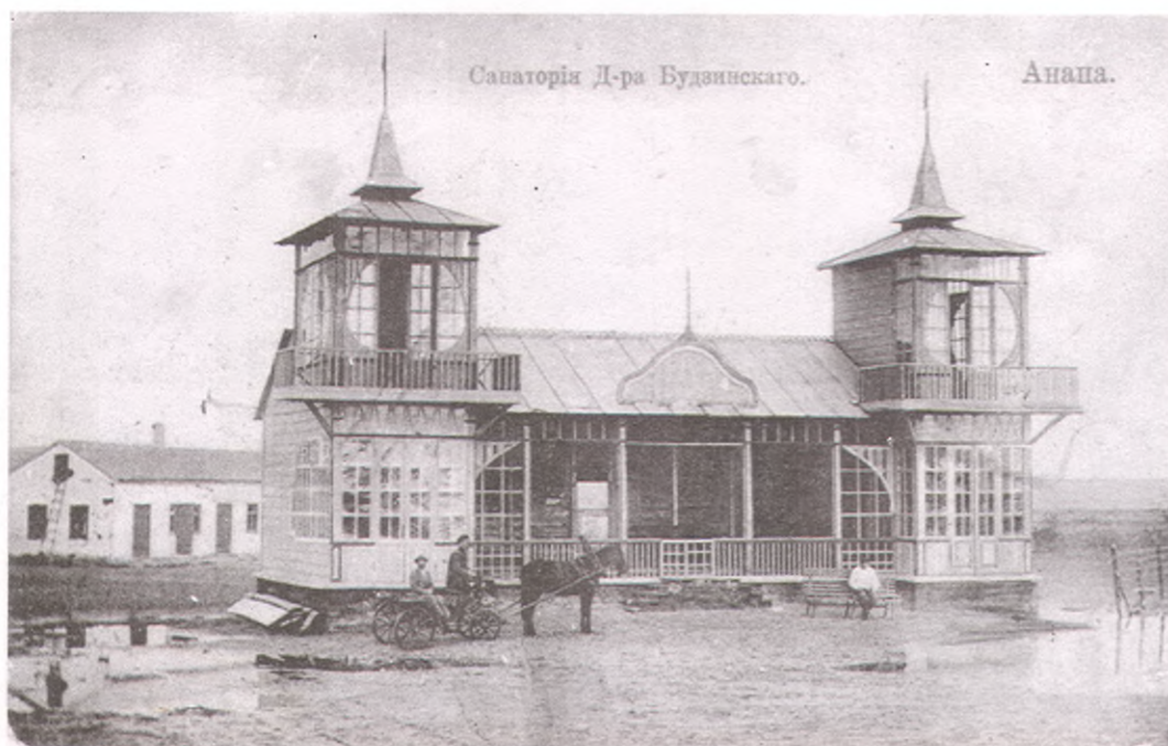
Детский санаторий «Бимлюк»