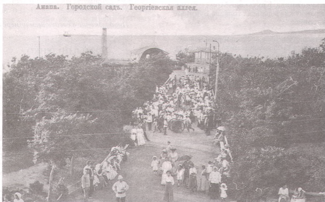
Городской сад. Георгиевская аллея.