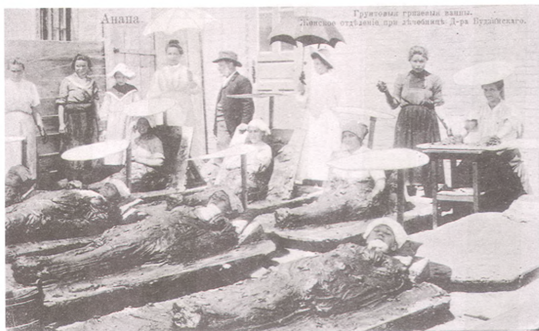
Грунтовые грязевые ванны