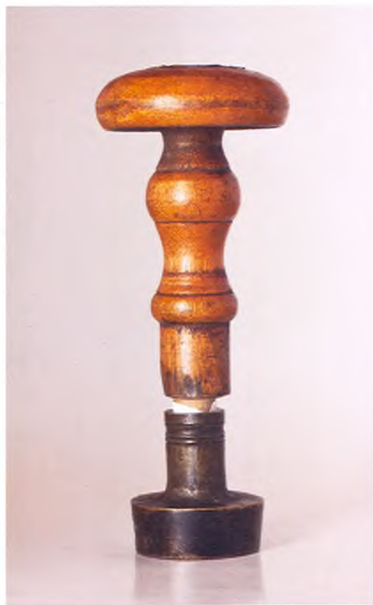
Матрица печати 5-го пешего пластунского батальона ККВ.