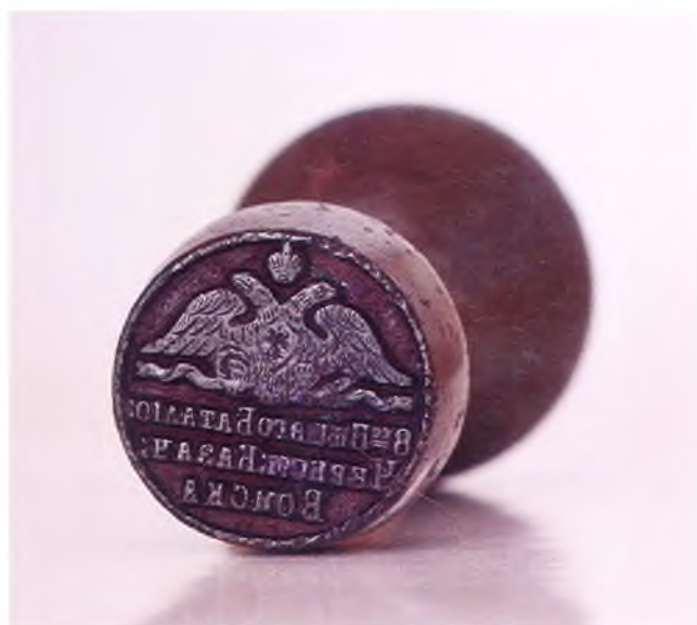
Матрица печати 8-го пешего батальона ЧКВ.