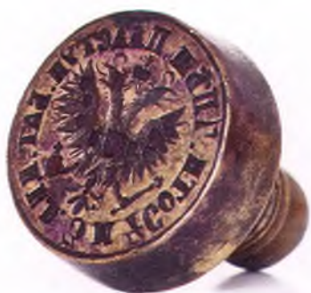
Матрица печати 3-ей и 4-ой сотни