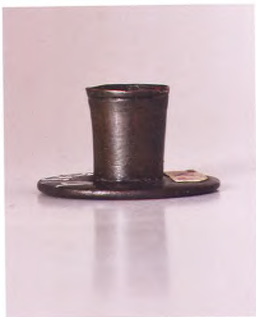
Матрица печати Пашковского куреня.