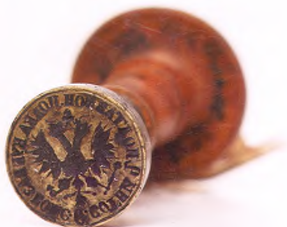
Матрица печати 6-ой сотни 2-го конного полка ККВ.