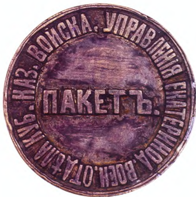
40. Печать Управления Екатеринодарского военного отдела ККВ.