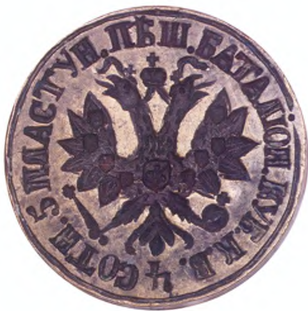
29. Печать 4-ой сотни 5-го пешего пластунского батальона ККВ.