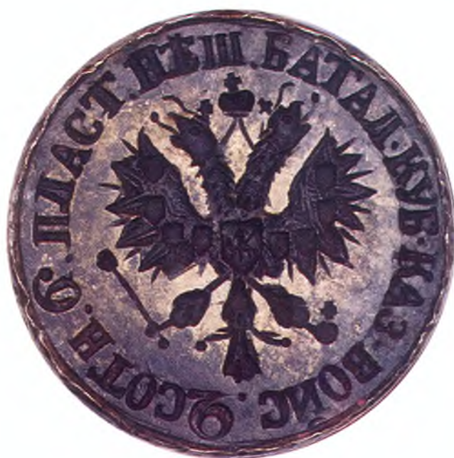
28. Печать 2-ой сотни 6-го пешего пластунского батальона ККВ.