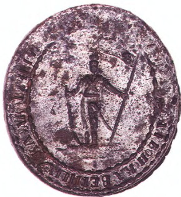
2. Печать Войска верных казаков.