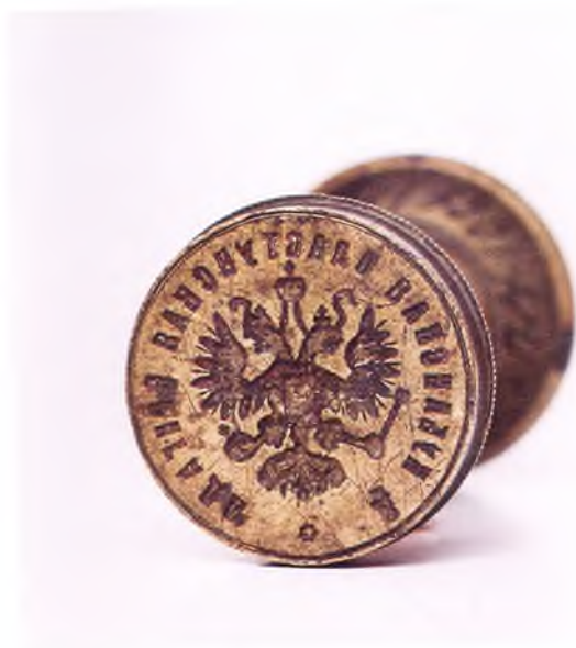
Матрица печати 4-ой Кубанской пластунской бригады.