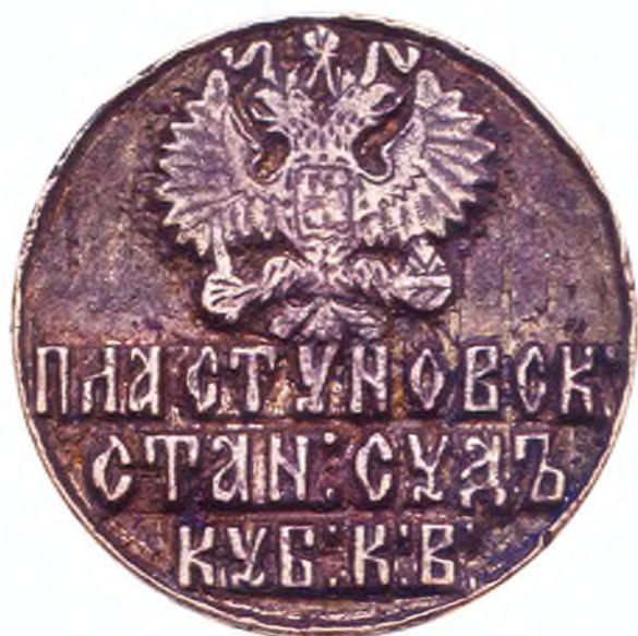
63. Печать Пластуновского станичного судьи ККВ.