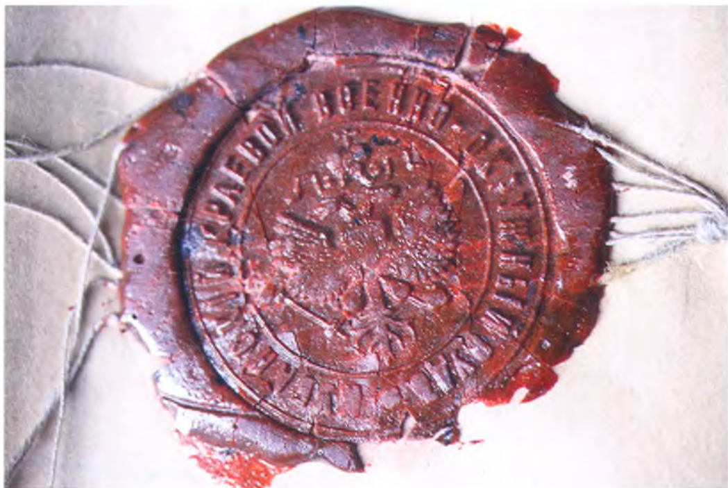
Печать Кубанского краевого военно-окружного суда.