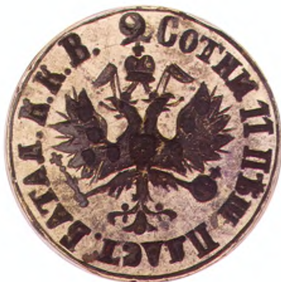
36. Печать 2-ой сотни 11-го пешего пластунского батальона ККВ.