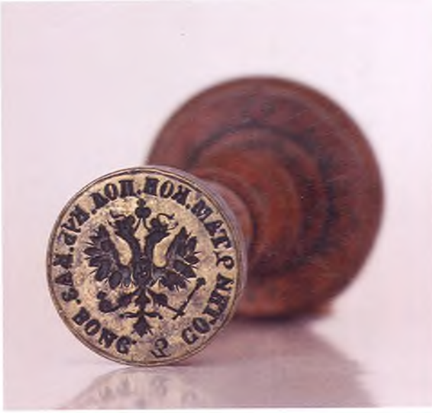
Матрица печати 3-ей сотни 2-го Таманского полка ККВ.