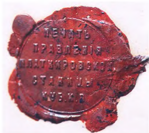
Печать правления Платнировской станицы.