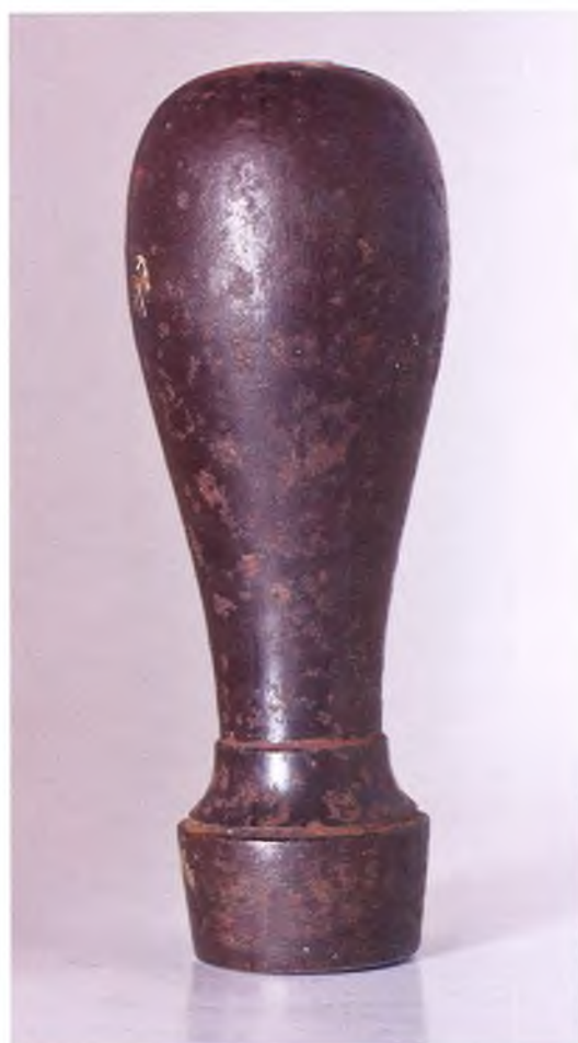
Матрица печати Екатеринодарского военного отдела ККВ.