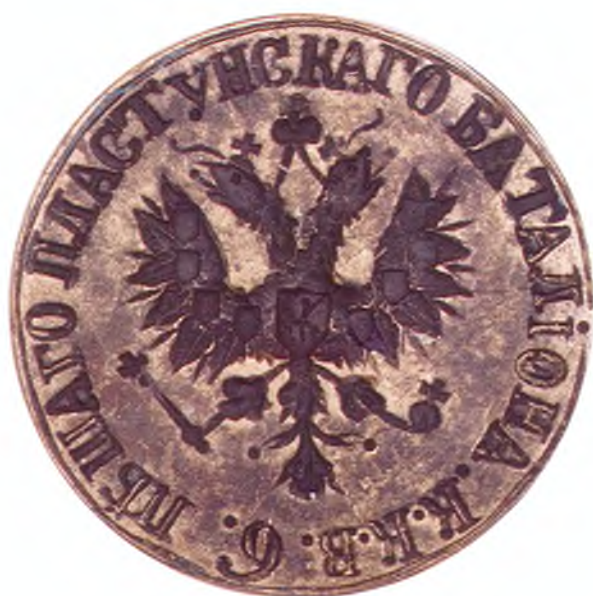
30. Печать 6-го пешего пластунского батальона ККВ.