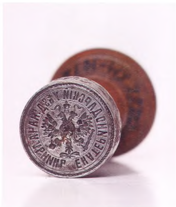
Матрица печати Екатеринодарского уездного начальника.