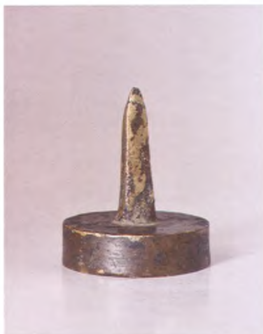
Матрица печати Белореченского станичного правления ККВ.