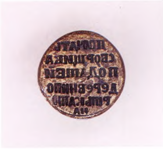
Матрица печати сборщика податей.