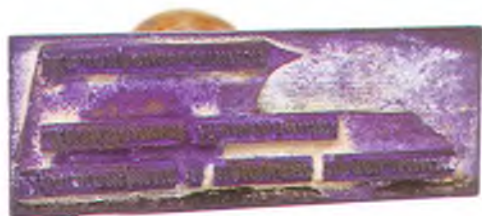
Матрица штампа дивизионного интенданта.