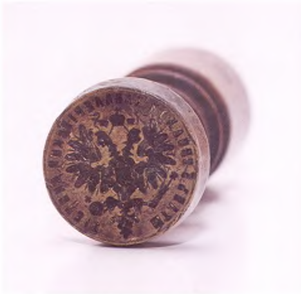
Матрица печати штаба 3-ей сводной кавдивизии.