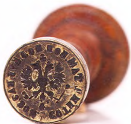
Матрица печати 4-ой сотни 2-го Таманского полка ККВ.