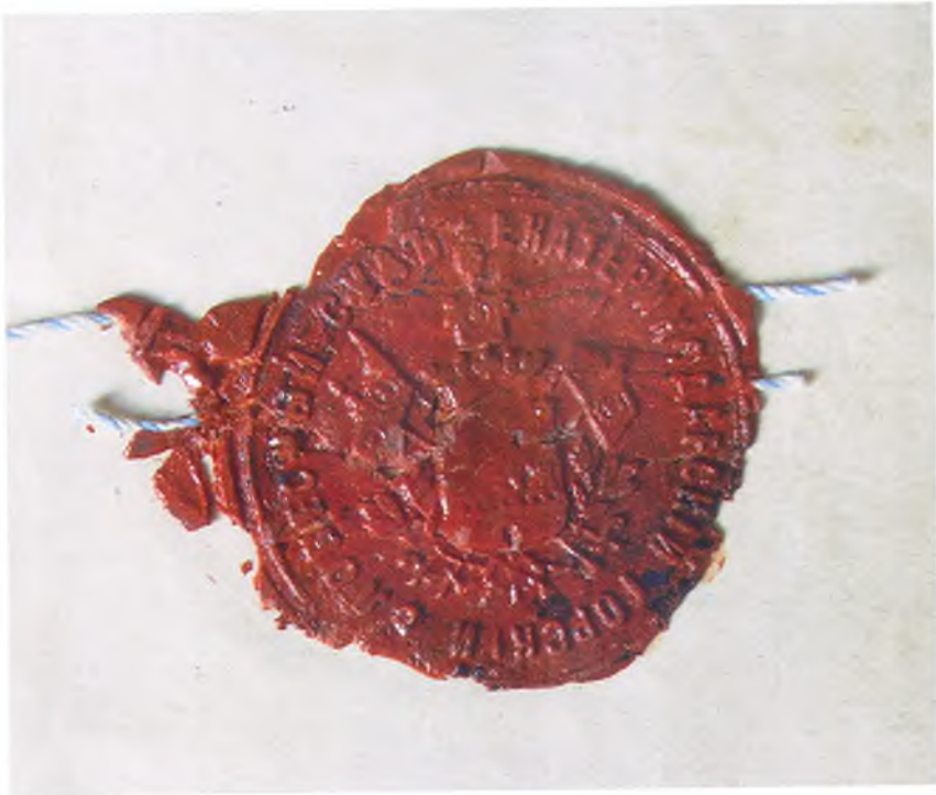
Печать Екатеринодарского горского суда.