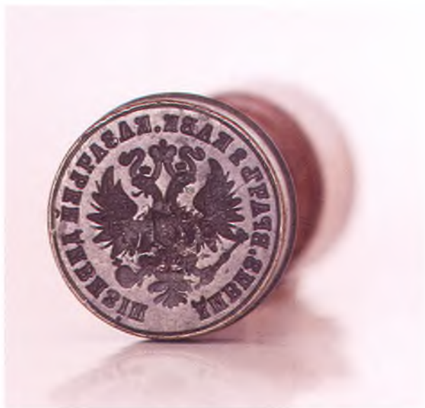
Матрица печати дивизионного врача 2-ой Кавказской казачьей дивизии.