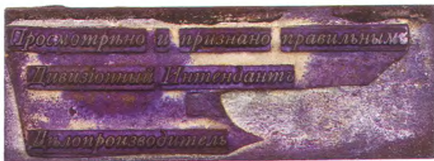
62. Штамп дивизионного интенданта.