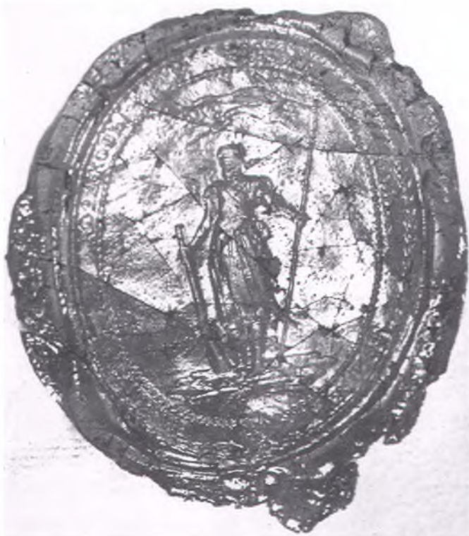
Печать Коша Войска верных казаков. Пожалована императрицей Екатериной II в 1788 г. Сургучный оттиск.

На матрице печати вырезано изображение вооруженного казака. В левой руке (ориентировка сторон дается по оттиску) он держит знамя с двумя извивающимися хвостами (двукосичный прапор). На полотнище чётко виден четырёхконечный крест с расширяющимися лучами, наподобие георгиевского. В геральдике кресты подобной формы назывались также прямым каноническим, австрийским пушечным, укороченным лапчатым. Появление изображений крестов с расширяющимися концами исследователи обычно связывают с легендой о знамени византийскому императору Константину: перед битвой с претендентом на престол Максентием Константину якобы явился «образ креста господня» с надписью «Сим знаком победишь» [14].