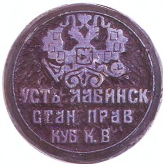
Печать Усть-Лабинского станичного правления. (оборот)

64. Двусторонняя печать Екатеринодарского городского полицейского управления, Усть-Лабинского станичного правления ККВ.