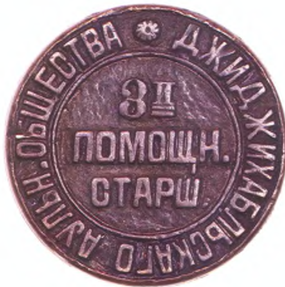
73. Печать 3-го помощника старшины Джиджихабльского аульного общества.