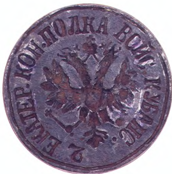
10. Печать 2-го Екатеринодарского конного полка ККВ.