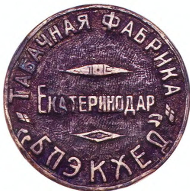
72. Печать табачной фабрики «Блэкхед».