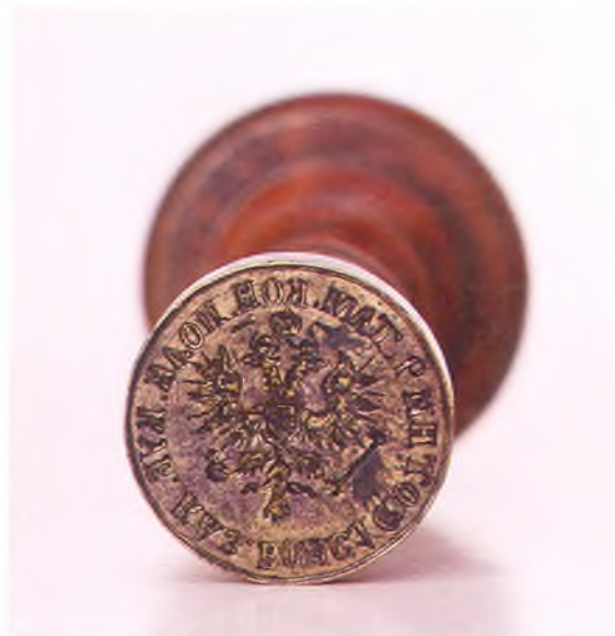
Матрица печати 1-ой сотни 2-го Таманского полка ККВ.