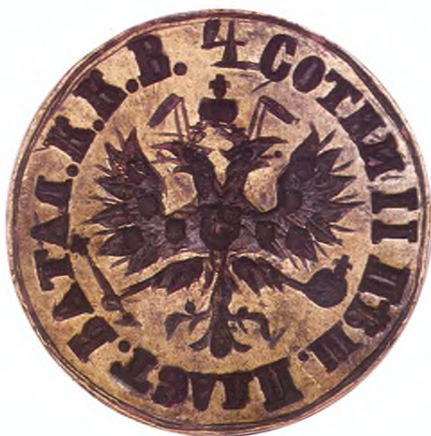
38. Печать 4-ой сотни 11-го пешего пластунского батальона ККВ.