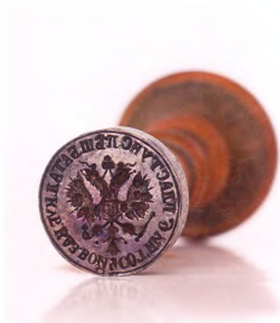
Матрица печати 4-ой сотни 6-го пешего пластунского батальона ККВ.