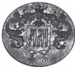
77. Матрица печати с монограммой «А» и «М».

Железный штемпель квадратной формы со скошенными углами, с зеркально-углублённым изображением. В центре, в овале с крестом на вершине монограмма из двух букв «ММ». Над овалом – летящий святой дух в солнечном сиянии, с правой стороны – голова херувима, слева – дерево на земле. Датируется началом XX в. Размер: 2,0x2,0 см. КМ–1086, ПЧ–53.