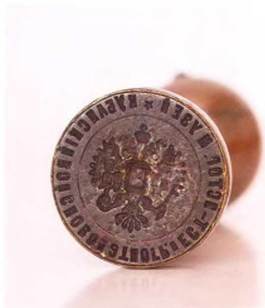
Матрица печати Кубанского войскового и естественно-исторического музея.