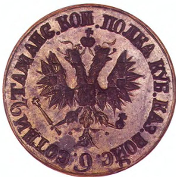
20. Печать 6-ой сотни 2-го Таманского полка ККВ.