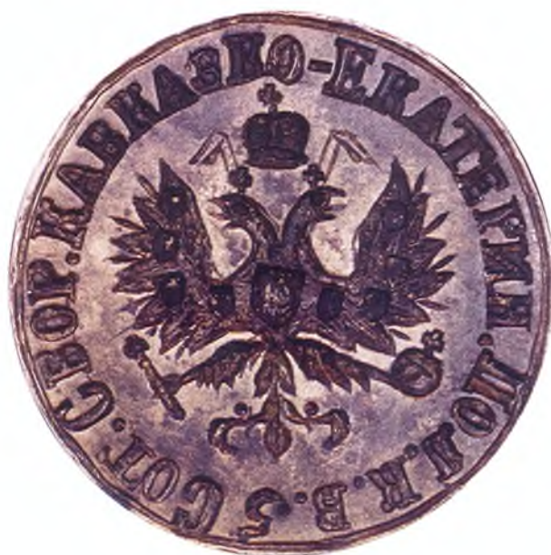
15. Печать 5-ой сотни сборного Кавказско-Екатеринодарского полка ККВ.