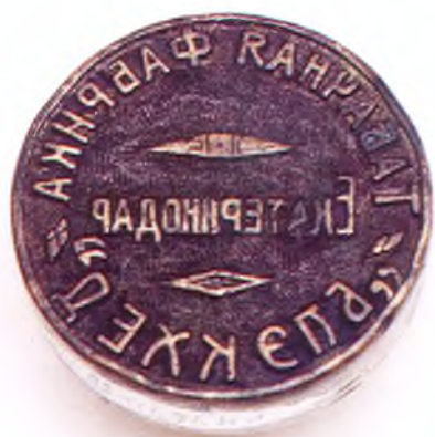
Матрица печати табачной фабрики «Блэкхед».