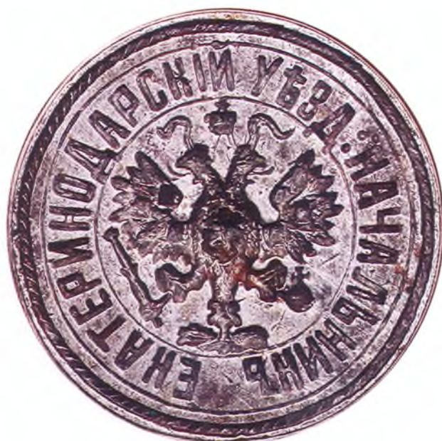
43. Печать Екатеринодарского уездного начальника.