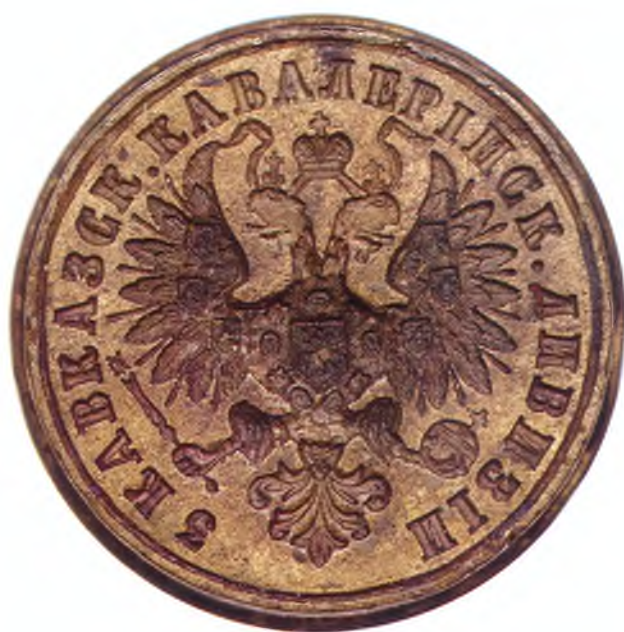
48. Печать 3-ей Кавказской кавдивизии.