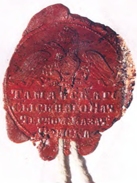
Печать Таманского сысского начальства.