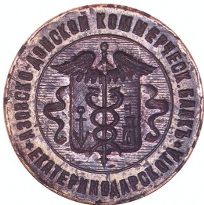
71. Печать Екатеринодарского отделения Азово-Донского коммерческого банка.