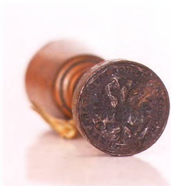
Матрица печати Таманско-Полтавского конного полка ККВ.