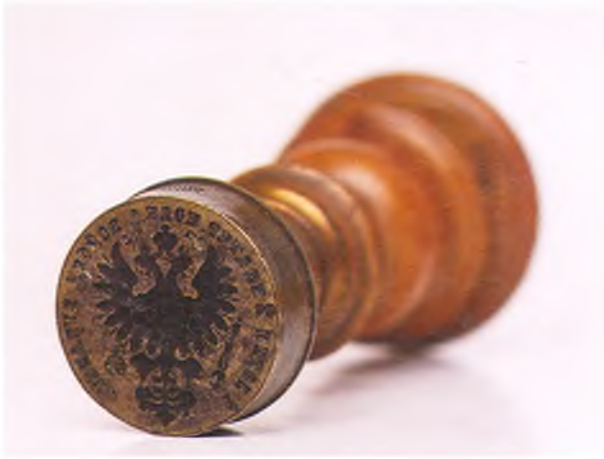
Матрица печати 1-ой сотни 2-го Екатеринодарского полка ККВ.