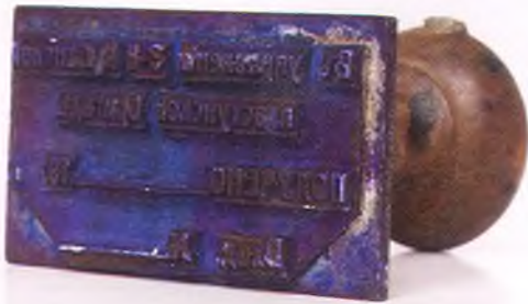
Матрица штампа для пакетов управления 3-ей Кубанской пластунской бригады.