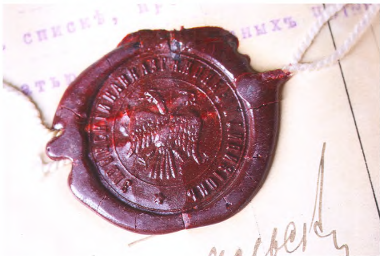
Печать Эллинского Кавказского конного дивизиона.