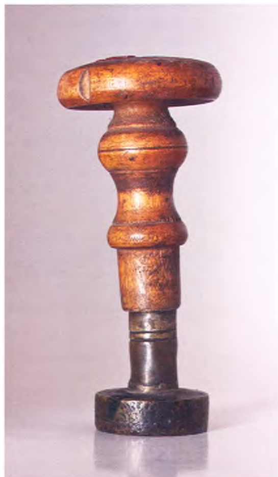
Матрица печати 2-ой сотни 6-го пешего пластунского батальона ККВ.