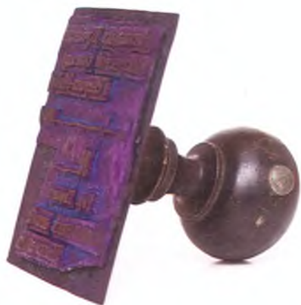
Матрица штампа начальника Кубанской пластунской бригады.