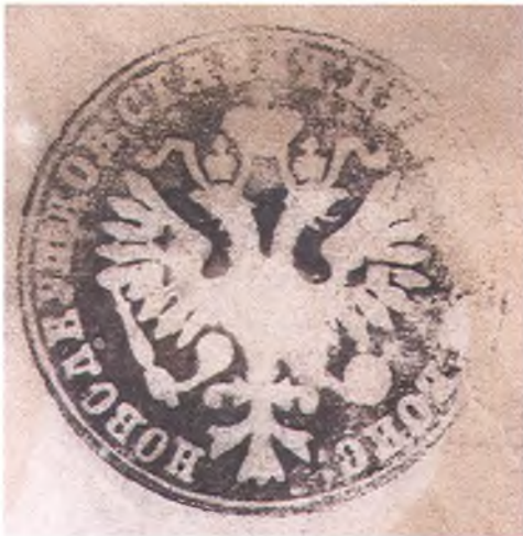
Печать станицы Новолевушковской.