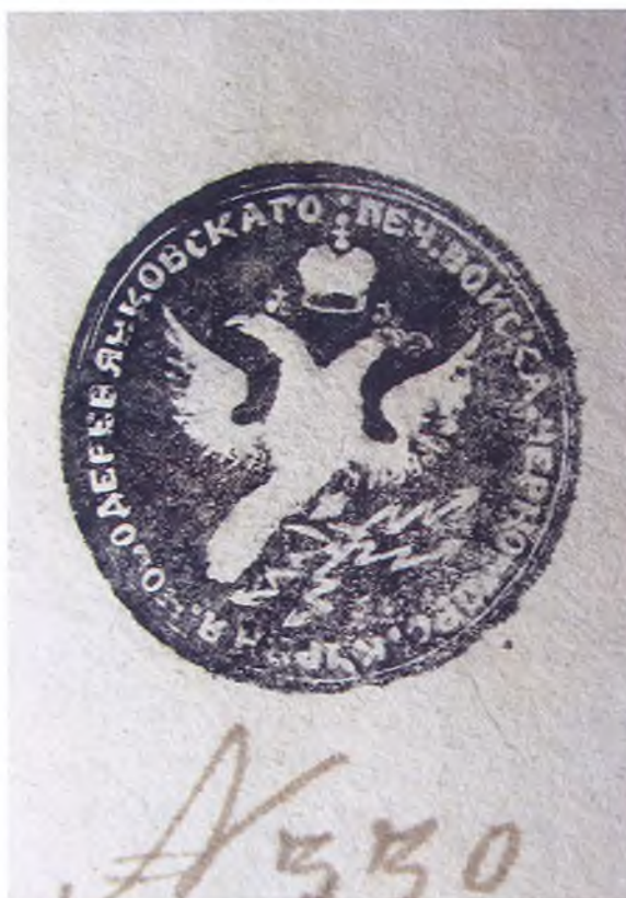
Печать куреня Новодеревянковского Черноморского войска.