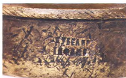
Клеймо на печати.