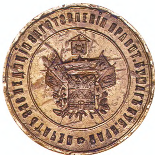
68. Печать экспедиции (учреждения) заготовления правительственных бумаг Кубанского края.