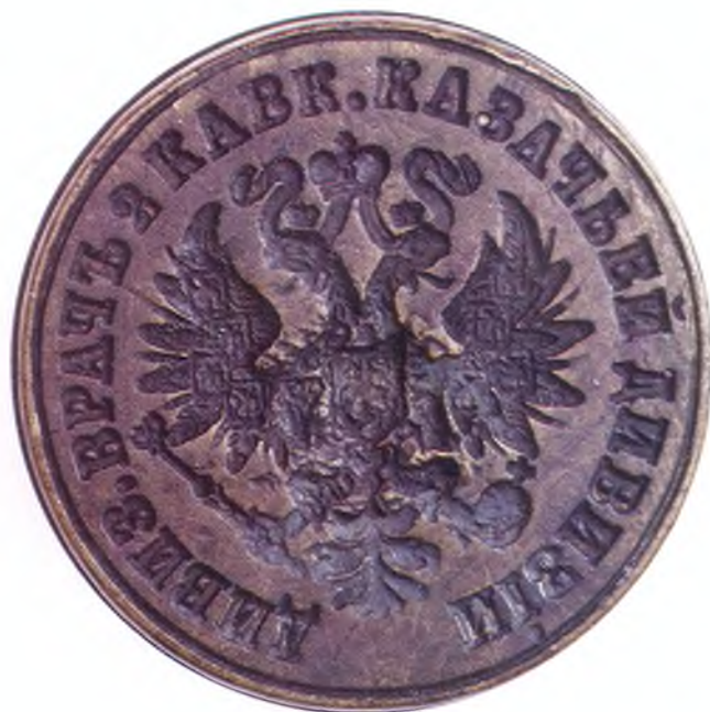
51. Печать дивизионного врача 2-ой Кавказской казачьей дивизии.