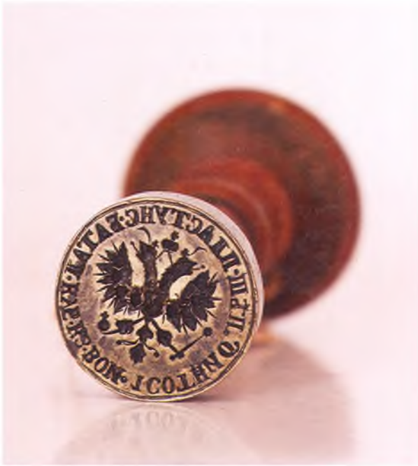
Матрица печати 1-ой сотни 6-го пешего пластунского батальона ККВ.