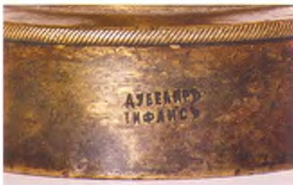
Клеймо на печати.