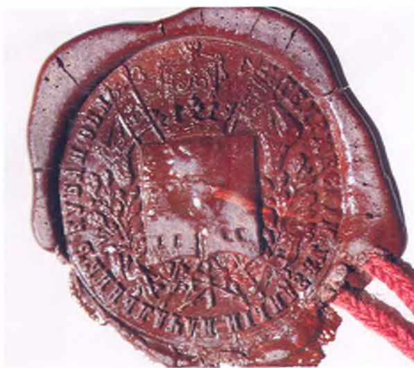
Печать Темрюковского уездного начальника Кубанской области.