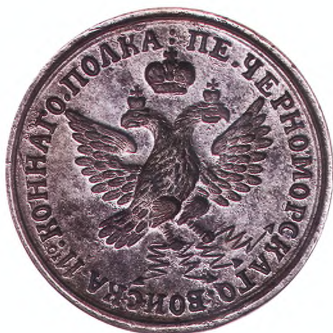
7. Печать 11-го конного полка ЧКВ.