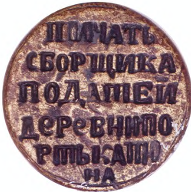
69. Печать сборщика податей.