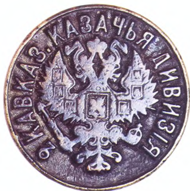
47. Печать 2-ой Кавказской казачьей дивизии.