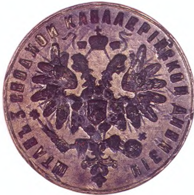
49. Печать штаба 3-ей сводной кавдивизии.