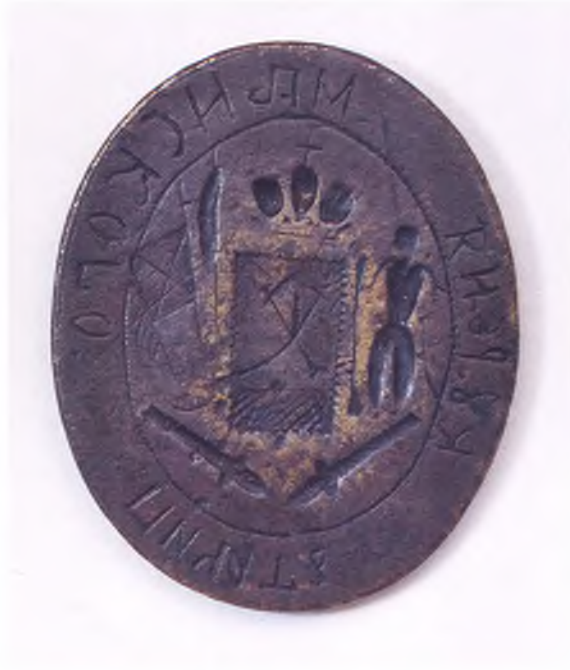
Матрица печати Минского куреня.