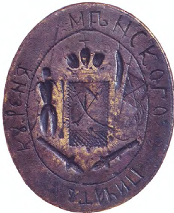
3. Печать Минского куреня.