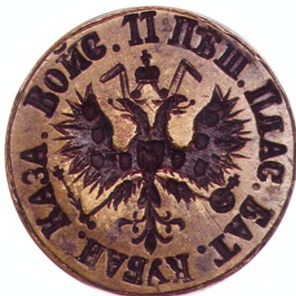
34. Печать 11-го пешего пластунского батальона ККВ.