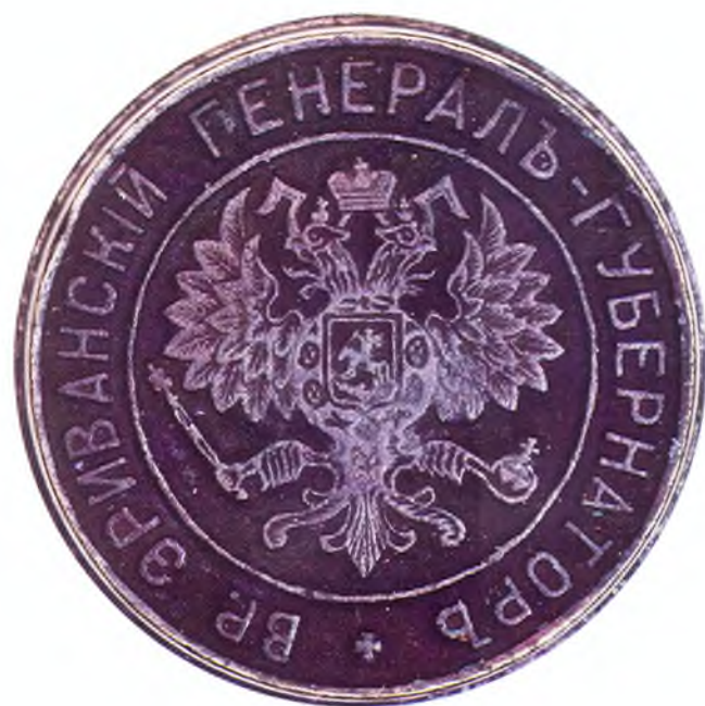
42. Печать Эриванского генерал-губернатора.