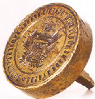
Матрица печати экспедиции (учреждения) заготовления правительственных бумаг Кубанского края.