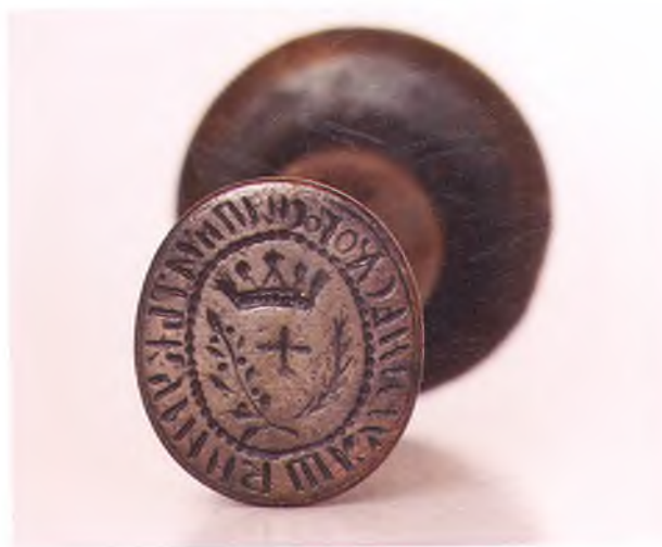
Матрица печати Шкуринского куреня.