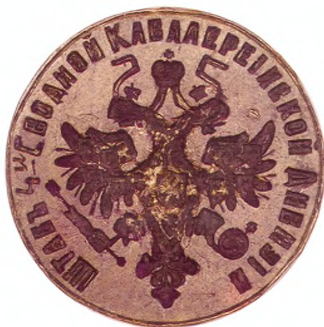
50. Печать штаба 4-ой сводной кавдивизии.