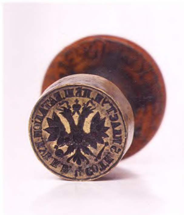
Матрица печати 4-ой сотни 5-го пластунского пешего батальона ККВ.