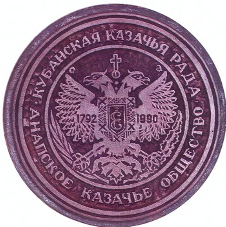
54. Печать Анапского казачьего общества Кубанской казачьей рады.