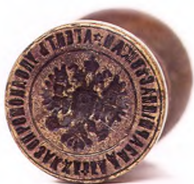
Матрица печати агента уполномоченного по заготовке хлеба для армии.