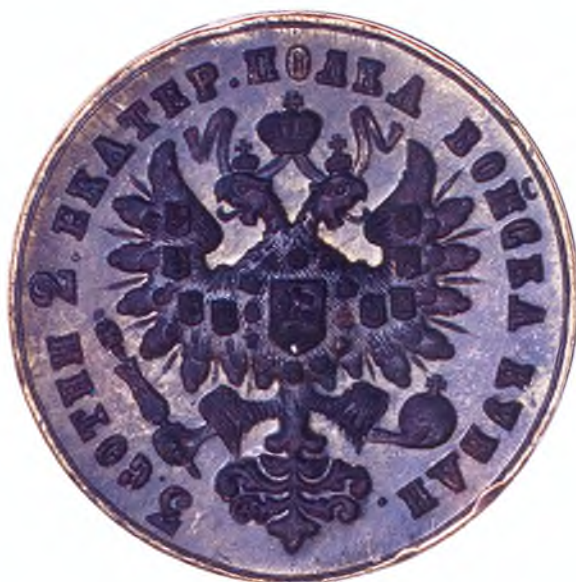
12. Печать 3-ей сотни 2-го Екатеринодарского полка ККВ.