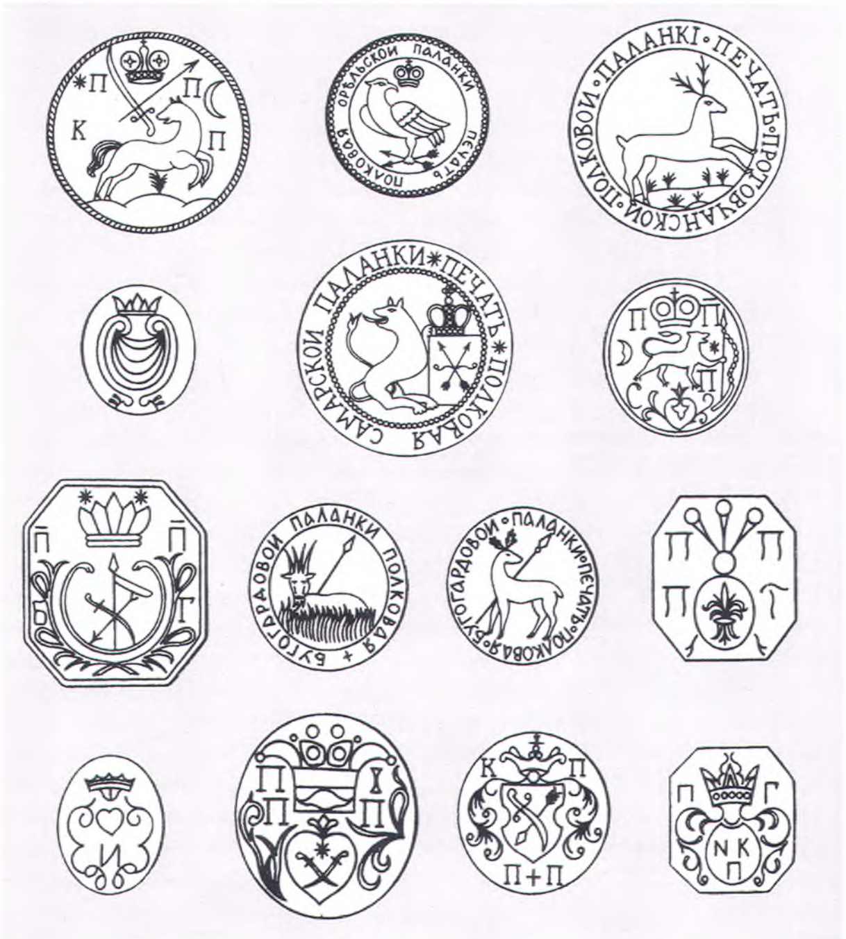
Печати паланок войска Запорожского.

Его отряд шел на Кубань длинным «северным путем» через Соколы, Берислав и земли войска Донского. 23 октября З.А. Чепега достиг границы пожалованной земли – речки Ея. Перезимовав в Ханском городке на Ейской косе (ныне на этом месте г. Ейск), отряд Чепеги 10 мая 1793 г. двинулся к южному рубежу войсковой земли – реке Кубань. Достигнув 19 мая строящейся крепости Усть-Лабинской, казаки пошли вниз по Кубани, расставляя пограничные кордоны. 12 июня Чепега достиг урочища Карасунский кут, «где и место сыскал под войсковой град» [31].