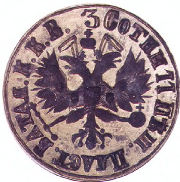
37. Печать 3-ей сотни 11-го пешего пластунского батальона ККВ.