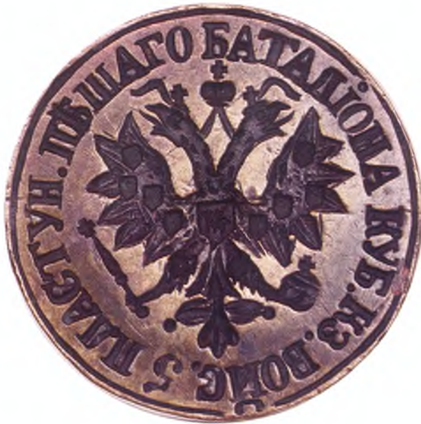
25. Печать 5-го пешего пластунского батальона Казачьего войска.