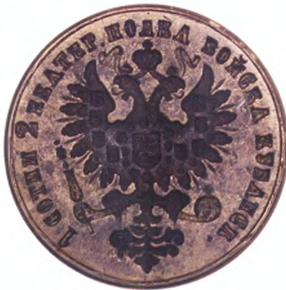
11. Печать 1-ой сотни 2-го Екатеринодарского полка ККВ.