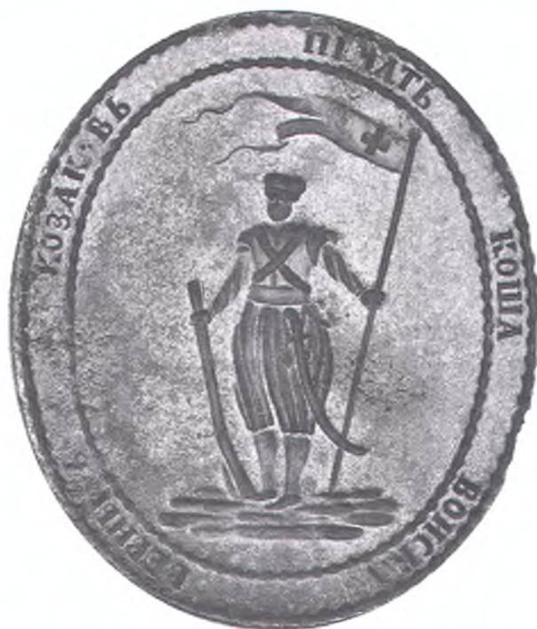
Печать Коша Войска верных казаков. Копия большой Императорской печати, изготовленной в Туле в 1788 г.

«черноморских». Стоит заметить, что «старые» печати из употребления не вышли и продолжали активно использоваться ещё несколько лет.