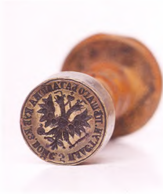
Матрица печати 5-го пешего пластунского батальона Казачьего войска.