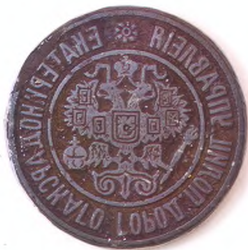
Матрица печати Екатеринодарского городского полицейского управления. (лицо)