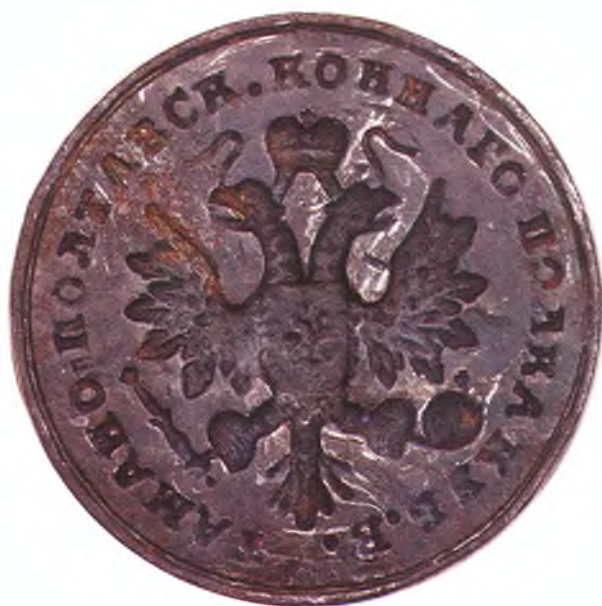
21. Печать Таманско-Полтавского конного полка ККВ.