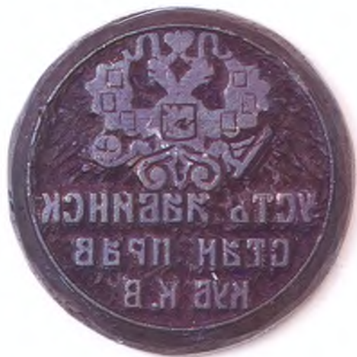
Матрица печати Усть-Лабинского станичного правления. (оборот)