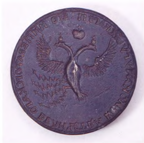
Матрица печати Чугуевского казачьего войска. (оборот)