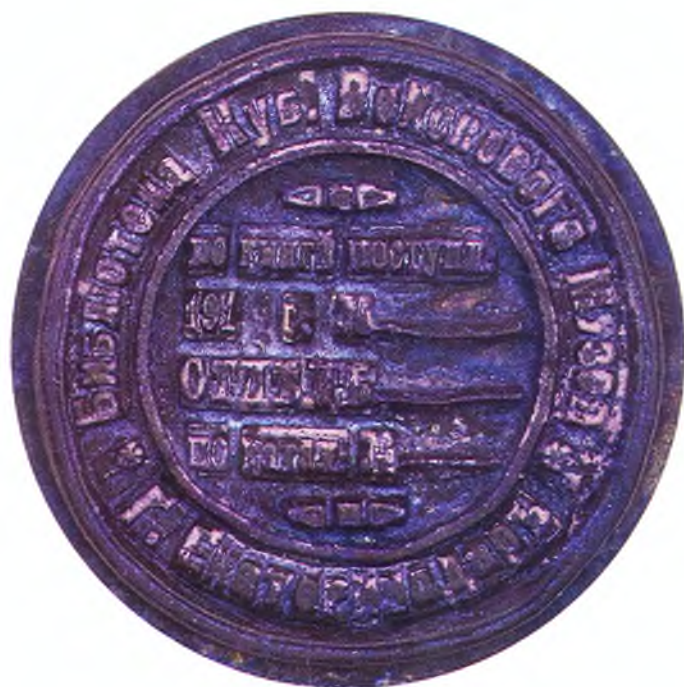
67. Печать библиотеки Кубанского войскового и естественно-исторического музея.