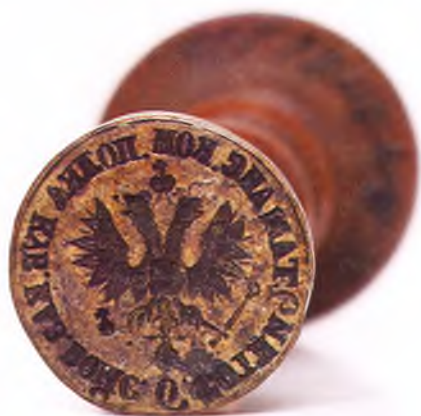
Матрица печати 6-ой сотни 2-го Таманского полка ККВ.