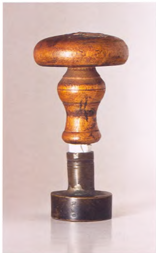
Матрица печати 2-ой сотни 5-го пешего пластунского батальона ККВ.