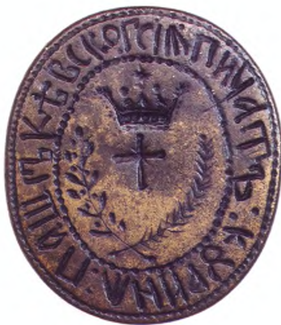
4. Печать Пашковского куреня.