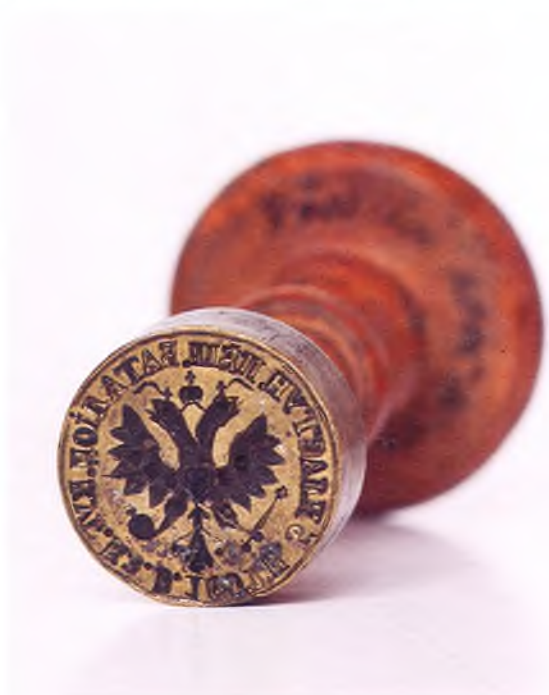
Матрица печати 1-ой сотни 5-го пешего пластунского батальона ККВ.