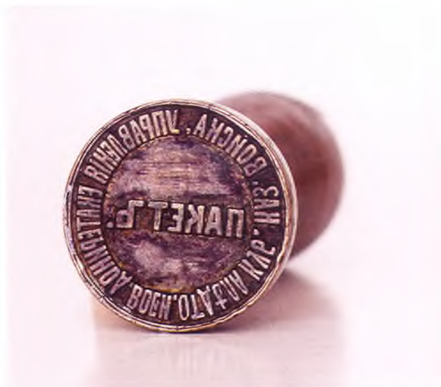
Матрица печати Управления Екатеринодарского военного отдела ККВ.