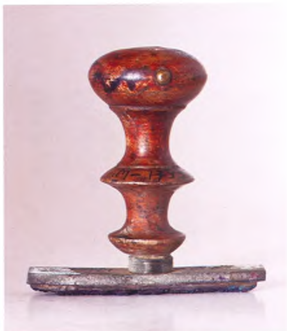
Матрица штампа начальника 4-ой Кубанской пластунской бригады.