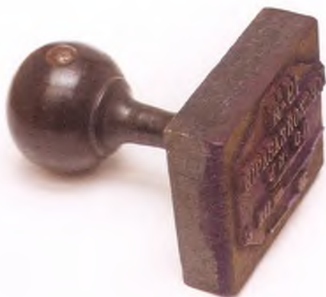
Матрица штампа 19-го Донского казачьего полка.