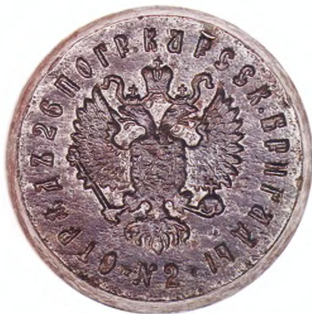
53. Печать 2-го отряда 26-ой пограничной Карсской бригады.