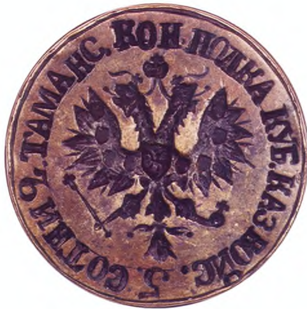
19. Печать 5-ой сотни 2-го Таманского полка ККВ.