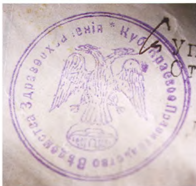
Печать ведомства здравоохранения Кубанского краевого правительства.