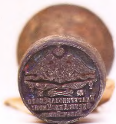
Матрица печати Екатеринодарского окружного дежурства ЧКВ.