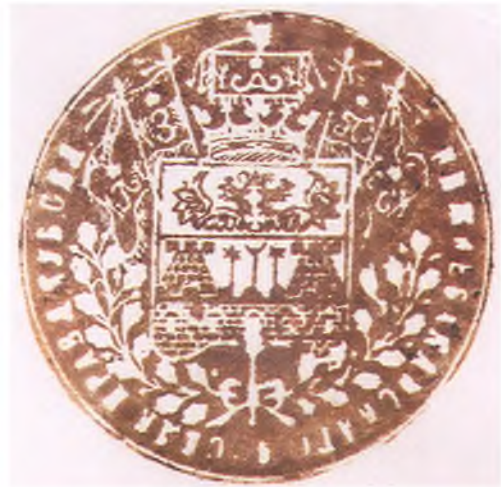
Печать Нижнебаканского поселкового правления.