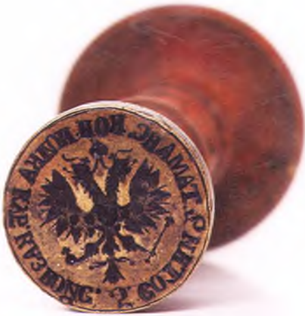
Матрица печати 5-ой сотни 2-го Таманского полка ККВ.