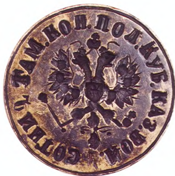
18. Печать 4-ой сотни 2-го Таманского полка ККВ.