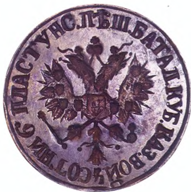
33. Печать 4-ой сотни 6-го пешего пластунского батальона ККВ.