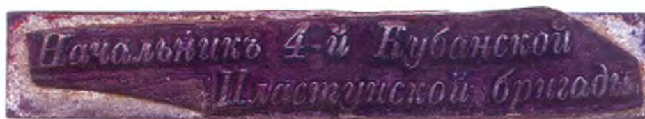
61. Штамп начальника 4-ой Кубанской пластунской бригады.