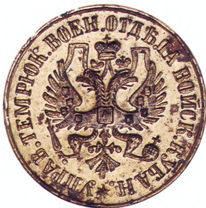
41. Печать Управления Темрюкского военного отдела ККВ.