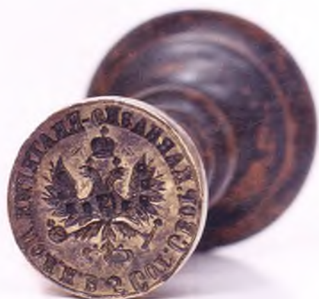
Матрица печати 5-ой сотни сборного Кавказско-Екатеринодарского полка ККВ.