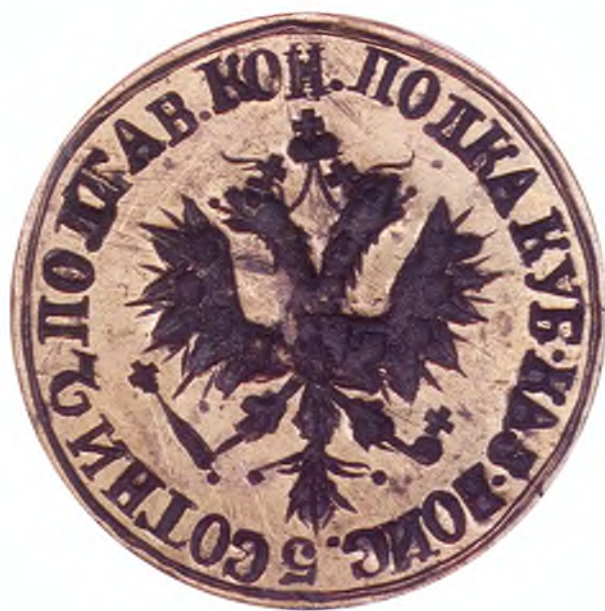
22. Печать 5-ой сотни 2-го Полтавского конного полка ККВ.