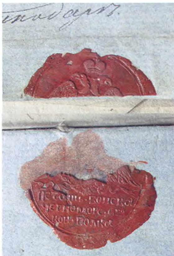
Печать 6-го конного полка Черноморского войска.