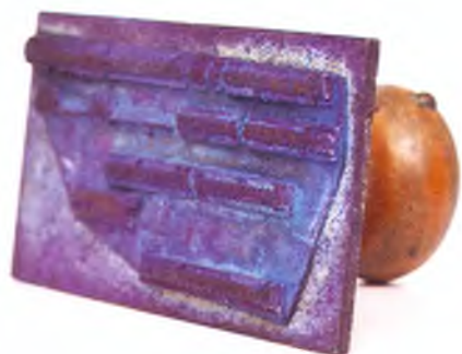
Матрица штампа дивизионного интенданта.