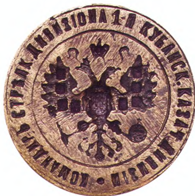
46. Печать командира стрелкового дивизиона 1-й дивизии ККВ.