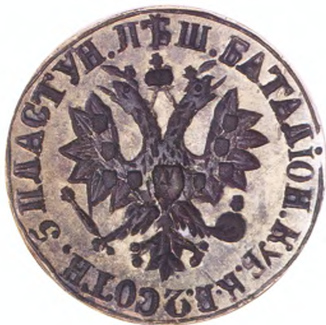
27. Печать 2-ой сотни 5-го пешего пластунского батальона ККВ.