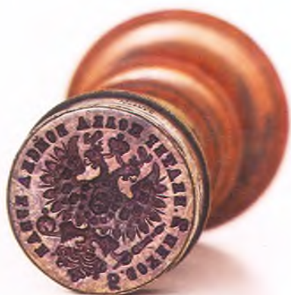
Матрица печати 5-ой сотни 2-го Екатеринодарского полка ККВ.