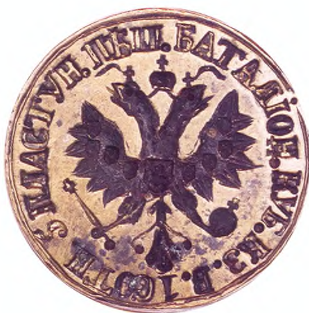
26. Печать 1-ой сотни 5-го пешего пластунского батальона ККВ.