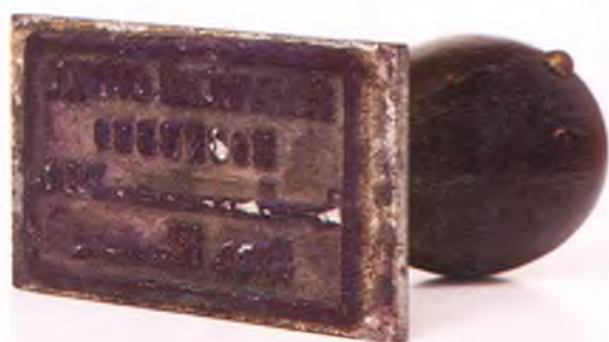
Матрица штампа для пакетов Эриванского отряда.