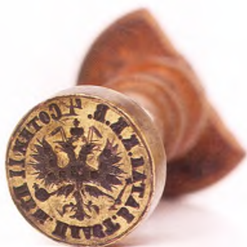
Матрица печати 4-ой сотни 11-го пешего пластунского батальона ККВ.