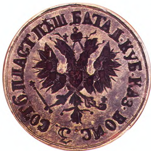
32. Печать 3-ей сотни 6-го пешего пластунского батальона ККВ.