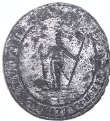
Печать Войска Черноморского. 1789 г.