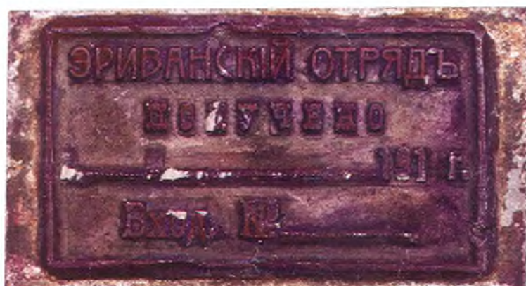
58. Штамп для пакетов Эриванского отряда.