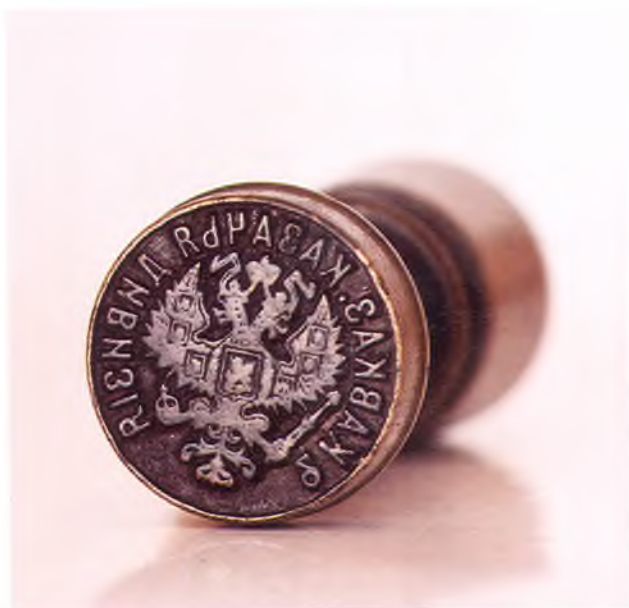
Матрица печати 2-ой Кавказской казачьей дивизии.