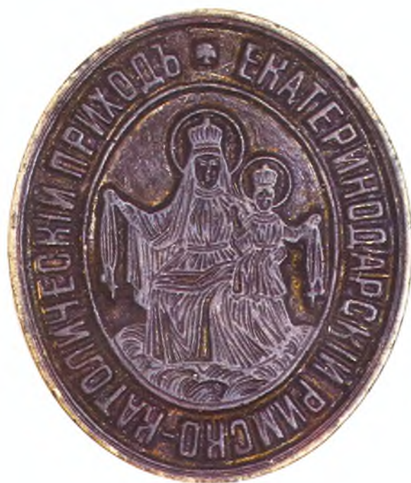
70. Печать Екатеринодарского римско-католического прихода.