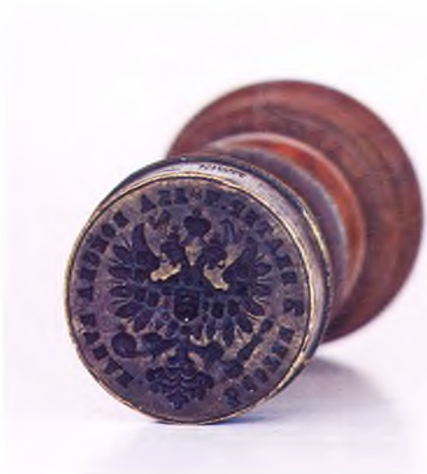
Матрица печати 3-ей сотни 2-го Екатеринодарского полка ККВ.