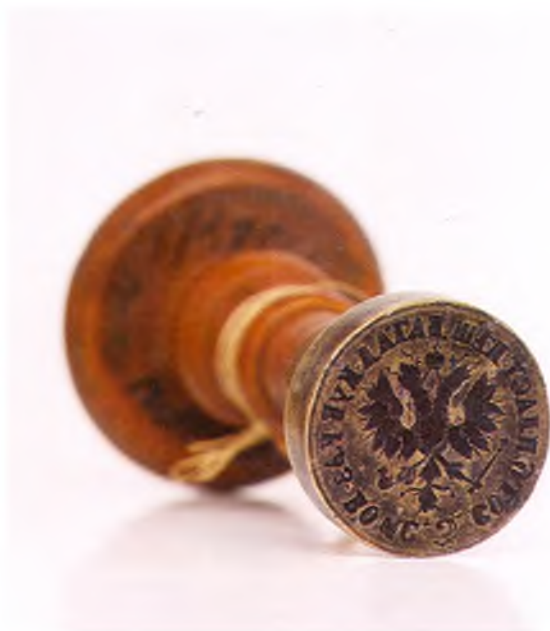
Матрица печати 3-ей сотни 6-го пешего пластунского батальона ККВ.