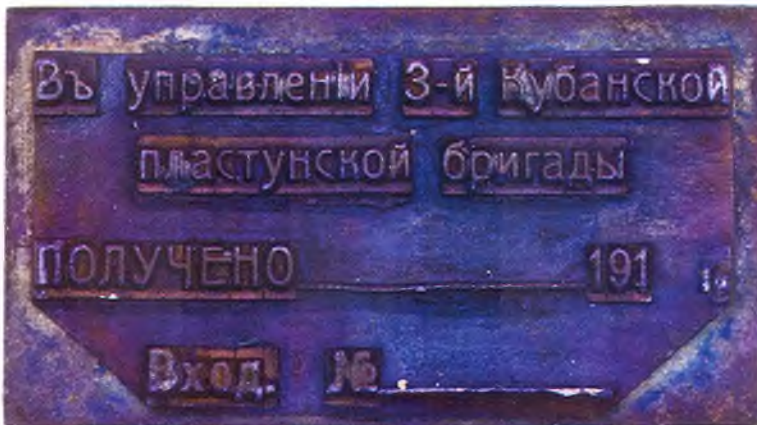
59. Штамп для пакетов управления 3-ей Кубанской пластунской бригады.