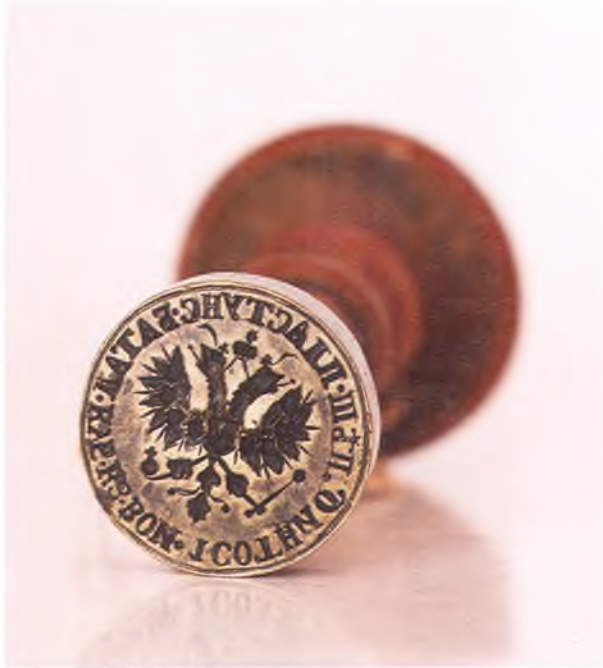
Матрица печати 1-ой сотни

11-го пешего пластунского батальона ККВ.