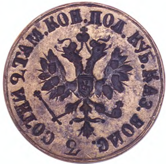
17. Печать 3-ей сотни 2-го Таманского полка ККВ.