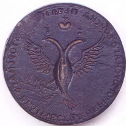
Матрица печати Черноморского казачьего войска. (лицо)