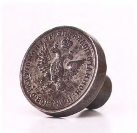
Матрица печати 11-го конного полка ЧКВ.