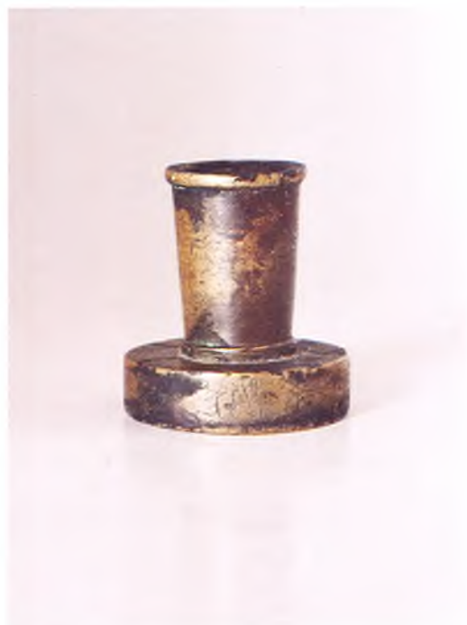
Матрица печати Пластуновского станичного судьи ККВ.