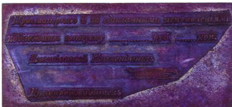
60. Штамп дивизионного интенданта.