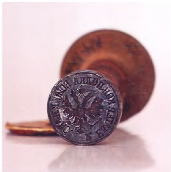
Матрица печати 2-го Екатеринодарского конного полка ККВ.