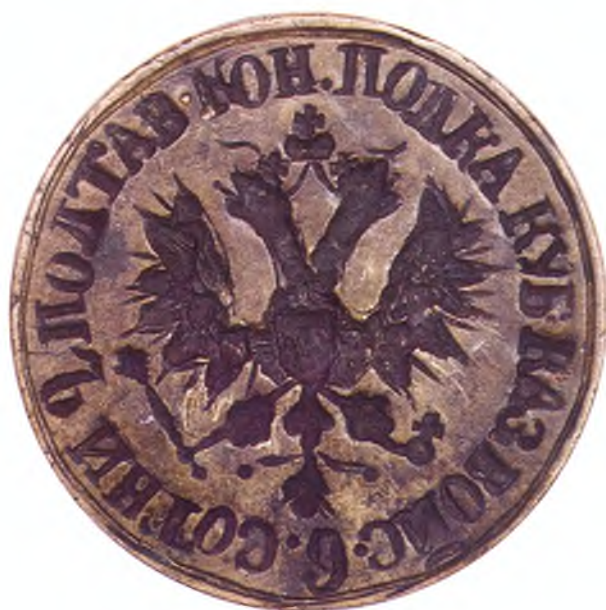
23. Печать 6-ой сотни 2-го конного полка ККВ.