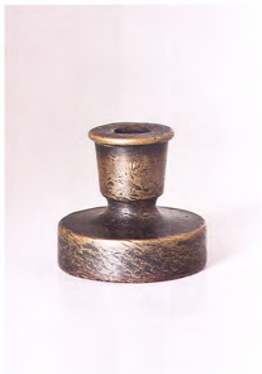
Матрица печати Екатеринодарского отделения Азово-Донского коммерческого банка.