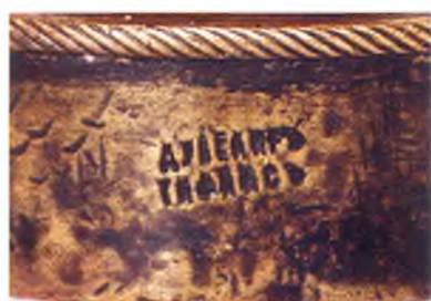
Клеймо на печати.