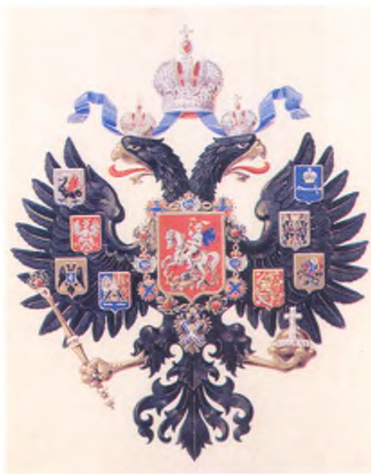
Российский Государственный Орел Царствования Императора Александра III.