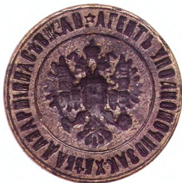
74. Печать агента уполномоченного по заготовке хлеба для армии.