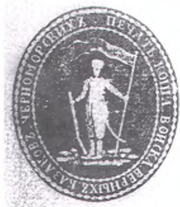
Печать Коша Войска верных казаков Черноморских. 1789 г.

Разразившийся в 1797 г. в Черномории «Персидский бунт» повлиял на внешний облик войсковых печатей. 8 января 1798 г. последовал высочайший указ об изъятии