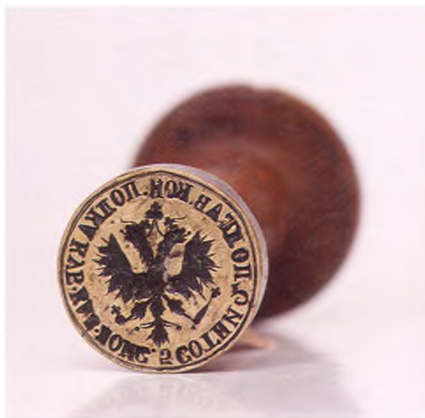
Матрица печати 5-ой сотни 2-го Полтавского конного полка ККВ.