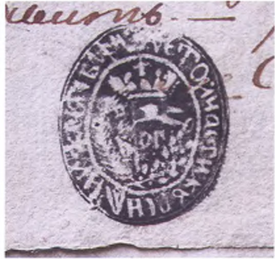
Печать куреня Нижестеблиевского.