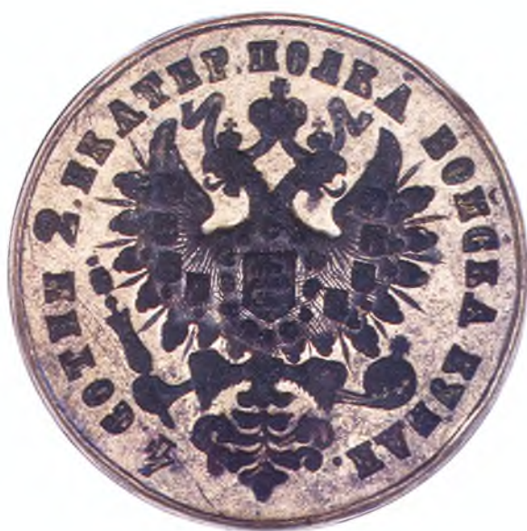
13. Печать 4-ой сотни 2-го Екатеринодарского полка ККВ.