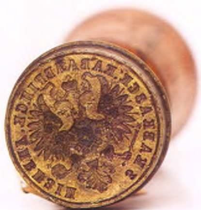
Матрица печати 3-ей Кавказской кавдивизии.