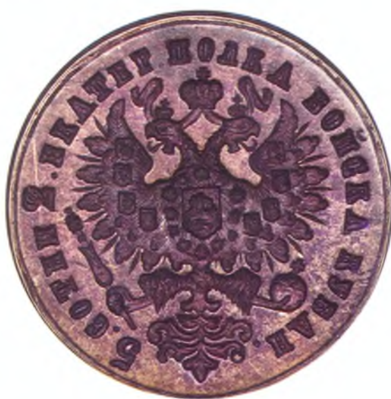
14. Печать 5-ой сотни 2-го Екатеринодарского полка ККВ.