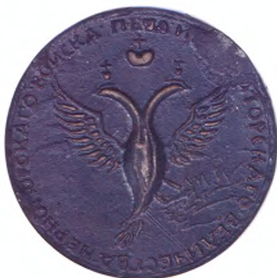
Печать Черноморского казачьего войска. (лицо)