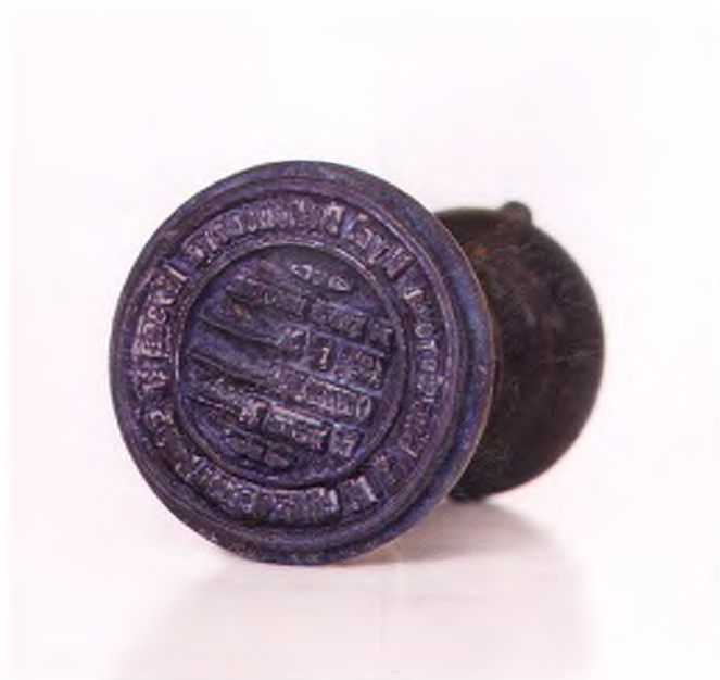
Матрица печати библиотеки Кубанского войскового и естественно-исторического музея.