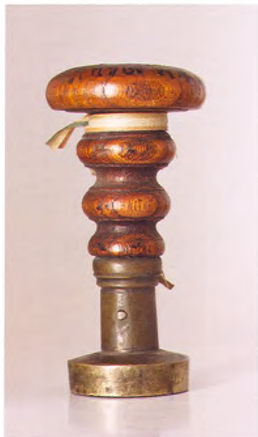
Матрица печати 2-ой сотни 11-го пешего пластунского батальона ККВ.