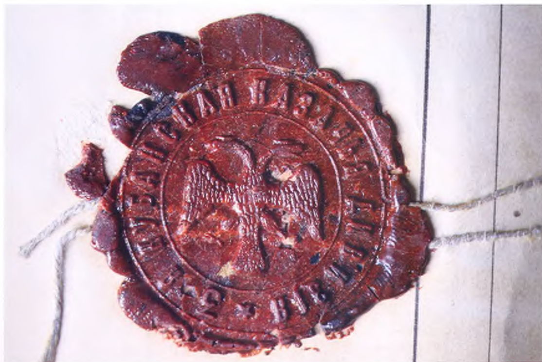
Печать 3-ей Кубанской казачьей дивизии (в центре – изображение орла периода Временного правительства).