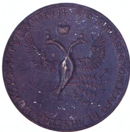
Печать Чугуевского казачьего войска. (оборот)