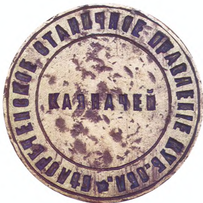
65. Печать Белореченского станичного правления ККВ.