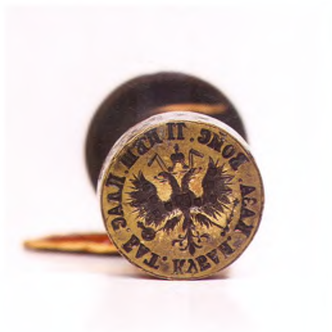
Матрица печати 11-го пешего пластунского батальона ККВ.