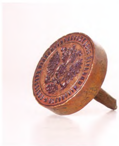
Матрица печати Кубанского казачьего воздухоплавательного дивизиона.