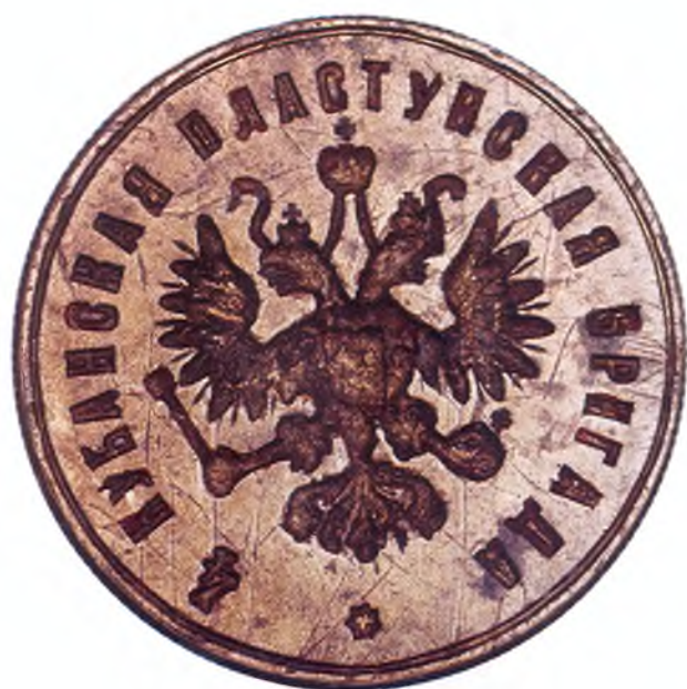
45. Печать 4-ой Кубанской пластунской бригады.