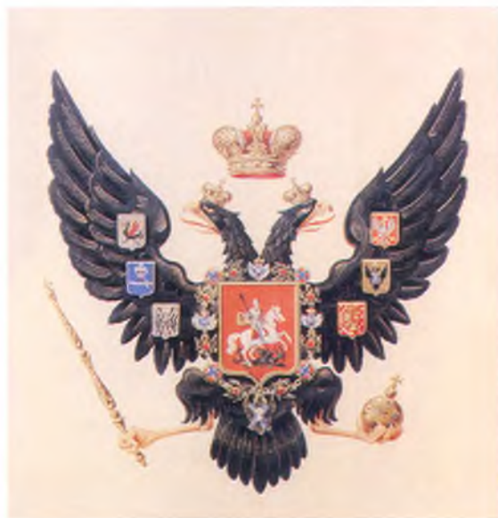
Российский Государственный Орел Царствования Императора Николая I.