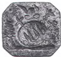
76. Матрица печати с монограммой «ММ».

Бронзовый штемпель цилиндрической формы с зеркально-углубленным изображением. Легенда: «УРЯДНИКЪ СЕРГИЕНКО В.Г.». Поступление советского периода, от заведующего крайпросветотделом Яковенко И.С. 31.X.55 г. Датируется второй половиной XIX в. Размер: d – 2,2 см. КМ–1090, ПЧ–57.