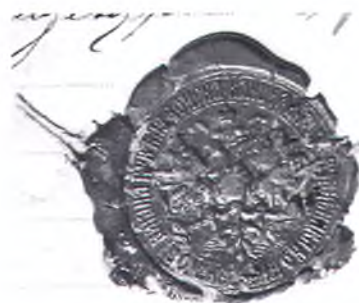
Печать Канцелярии Начальника Кубанской области и Наказного атамана Кубанского казачьего войска. Оттиск на красном сургуче. 1880-е гг.