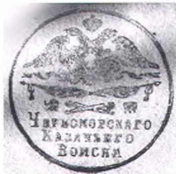
Печать Черноморского казачьего войска периода правления императора Николая I. Сажевый оттиск.

К удивлению, в архивных документах авторов до сегодняшнего дня не удалось найти ни одного оттиска печати Кубанского казачьего войска. Возможно, документы, заверенные этой печатью, направлялись в центральные государственные учреждения, поэтому их следует искать в петербургских и московских архивохранилищах. Не исключено, что роль войсковой печати играла печать Канцелярии Начальника Кубанской области и Наказного атамана Кубанского казачьего войска.