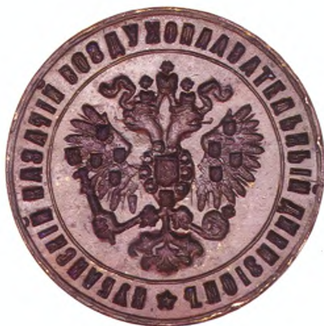
52. Печать Кубанского казачьего воздухоплавательного дивизиона.