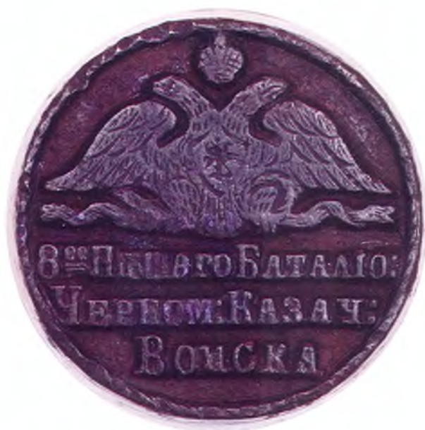
8. Печать 8-го пешего батальона ЧКВ.