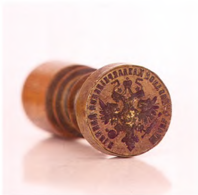
Матрица печати штаба 4-ой сводной кавдивизии.