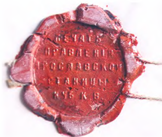
Печать правления Ярославской станицы.