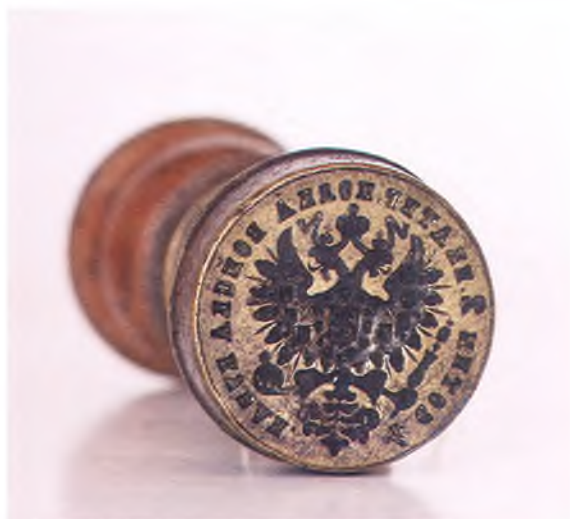
Матрица печати 4-ой сотни 2-го Екатеринодарского полка ККВ.