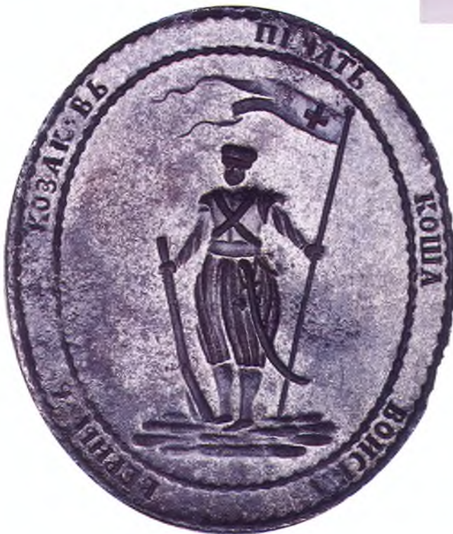
1. Печать Коша войска верных казаков.