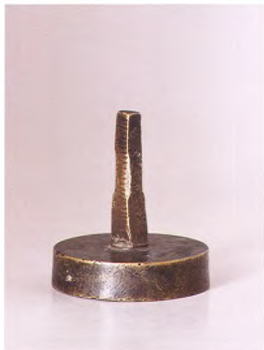
Матрица печати командира стрелкового дивизиона 1-й дивизии ККВ.