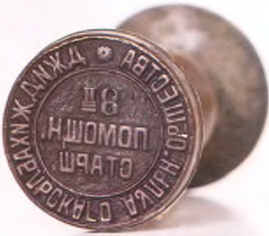
Матрица печати 3-го помощника старшины Джиджихабльского аульного общества.