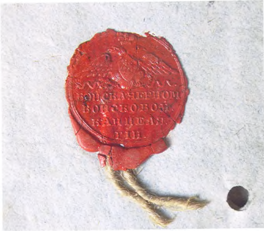
Печать Черноморской войсковой канцелярии.