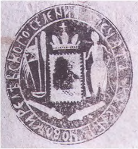
Печать куреня Новоджерелиевского.