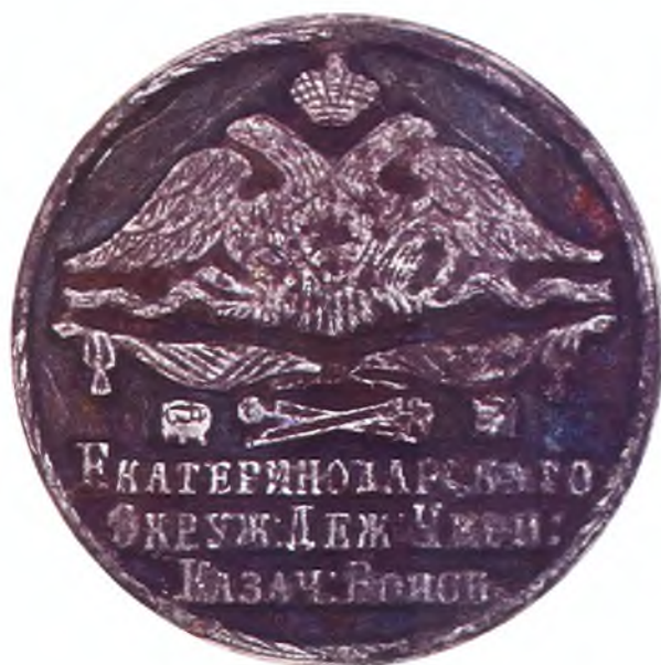
9. Печать Екатеринодарского окружного дежурства ЧКВ.