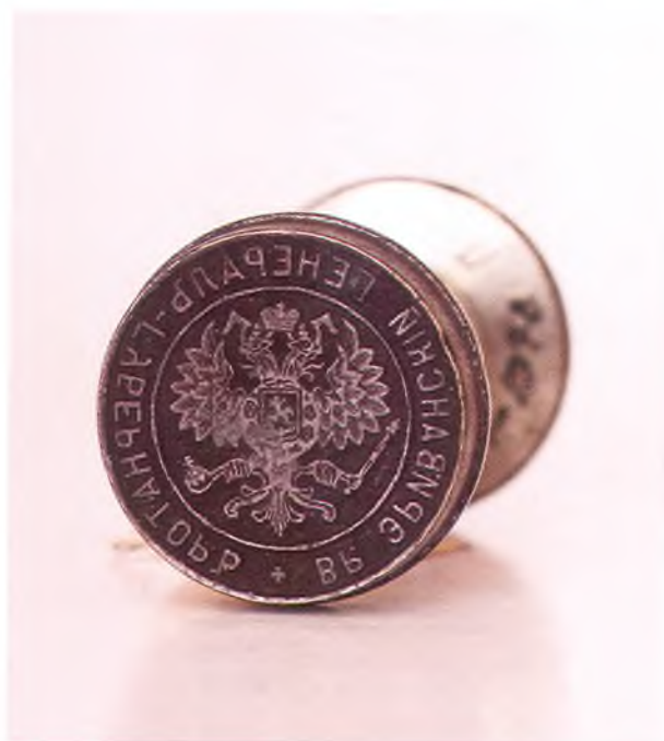
Матрица печати Эриванского генерал-губернатора.