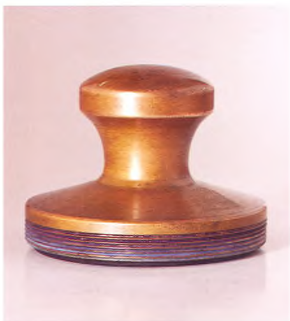
Матрица печати Анапского казачьего общества Кубанской казачьей рады.