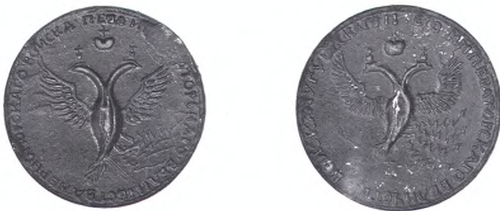
Каменный диск с изображением печатей Черноморского и Чугуевского казачьих войск. 1801 г. (?).

В фондах КГИАМЗ хранится каменная матрица печати Черноморского казачьего войска с вырезанным в центре «павловским» орлом. «Ассиметричный» орёл с поднятыми крыльями увенчан тремя коронами, туловище и хвост изогнуты влево.