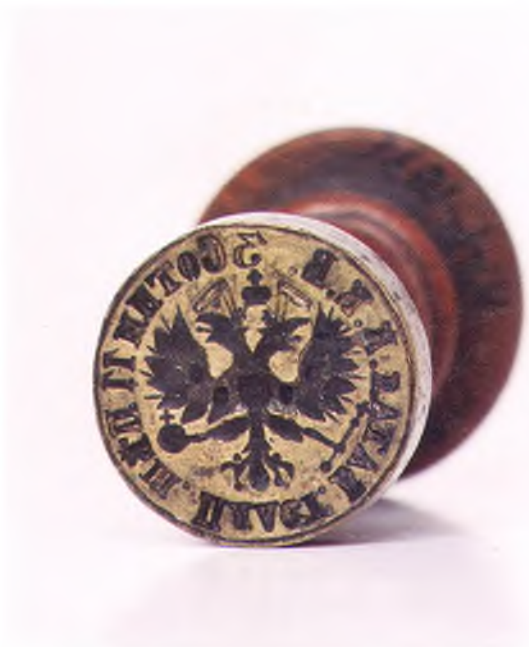
Матрица печати 3-ей сотни

11-го пешего пластунского батальона ККВ.