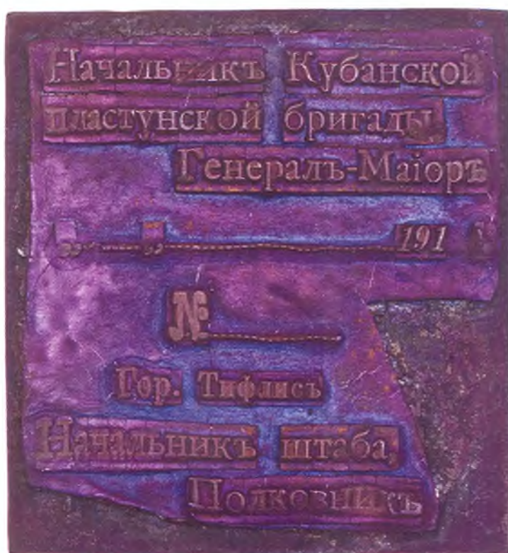
56. Штамп начальника Кубанской пластунской бригады.