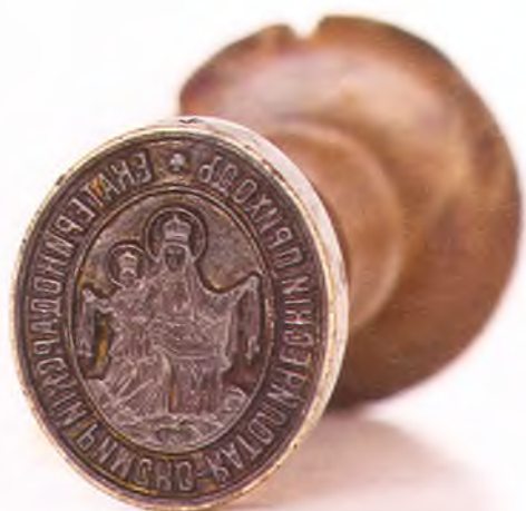
Матрица печати Екатеринодарского римско-католического прихода.