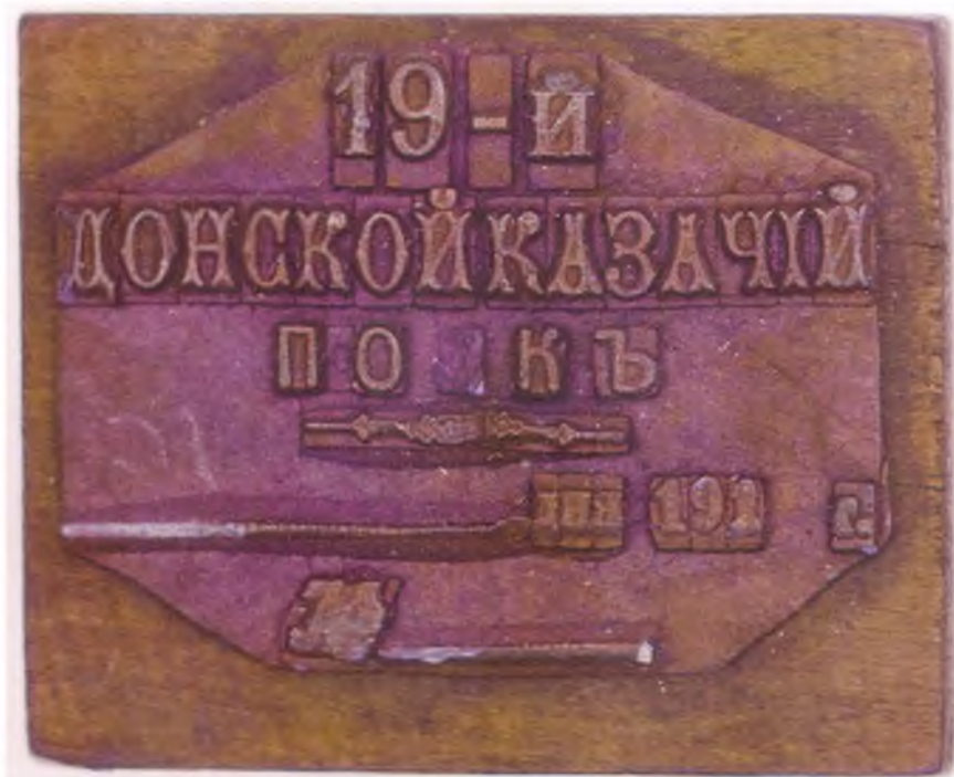
55. Штамп 19-го Донского казачьего полка.