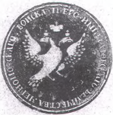
Печать Войска Черноморского. Сажевый оттиск. После 1801 г.