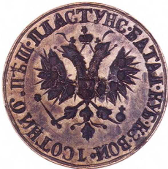
31. Печать 1-ой сотни 6-го пешего пластунского батальона ККВ.