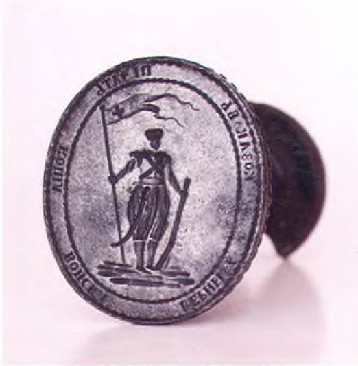
Матрица печати Коша войска верных казаков.