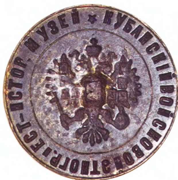
66. Печать Кубанского войскового и естественно-исторического музея.