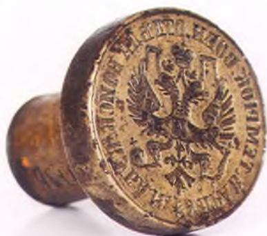
Матрица печати Управления Темрюкского военного отдела ККВ.