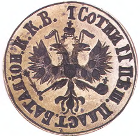
35. Печать 1-ой сотни 11-го пешего пластунского батальона ККВ.