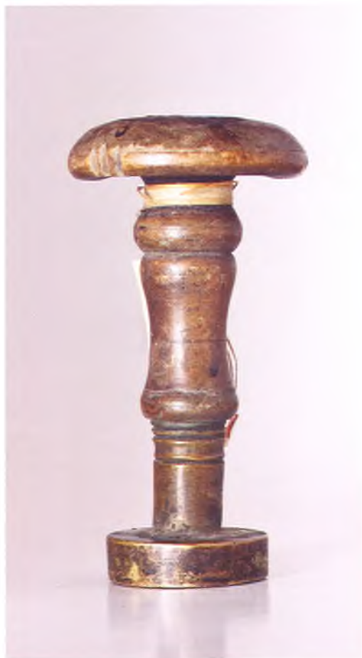
Матрица печати 6-го пешего пластунского батальона ККВ.