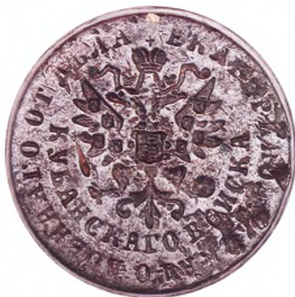
44. Печать Екатеринодарского военного отдела ККВ.