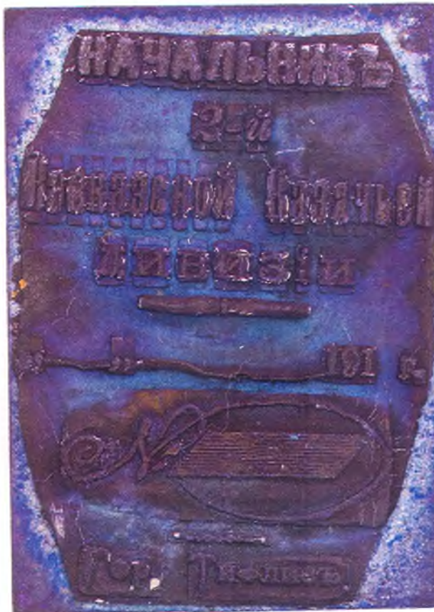
57. Штамп начальника 2-ой Кавказской кавдивизии.