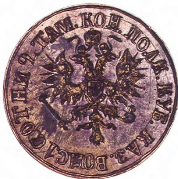
16. Печать 1-ой сотни 2-го Таманского полка ККВ.