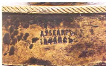
Клеймо на печати.