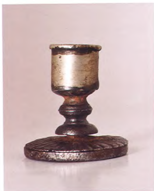
Матрица печати Войска верных казаков.