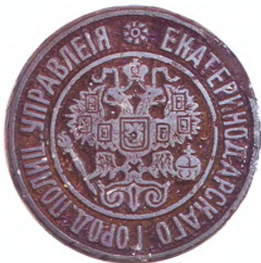
Печать Екатеринодарского городского полицейского управления. (лицо)