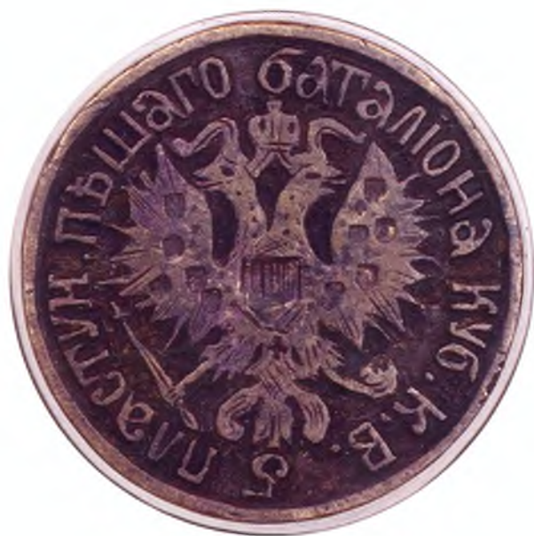
24. Печать 5-го пешего пластунского батальона ККВ.