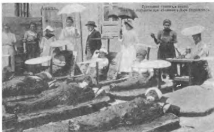
Грунтовые грязевые ванны. Женское отделение при лечебнице д-ра Будзинского.

4. Ортопедический институт. На лучшем на Черноморском побережье песчаном пляже для лечения рахита, золотухи, ревматизма, подагры, косолапости, искривлений позвоночника и конечностей, горбатости и всевозможных заболеваний костной и мышечной системы применяются преимущественно физические