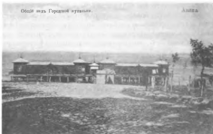
Общий вид городских купален.

Обставив себя со стороны жилища, содержания, купания и лечения, приезжему остается озаботиться вопросом об удовлетворении умственных и эстетических запросов своих и