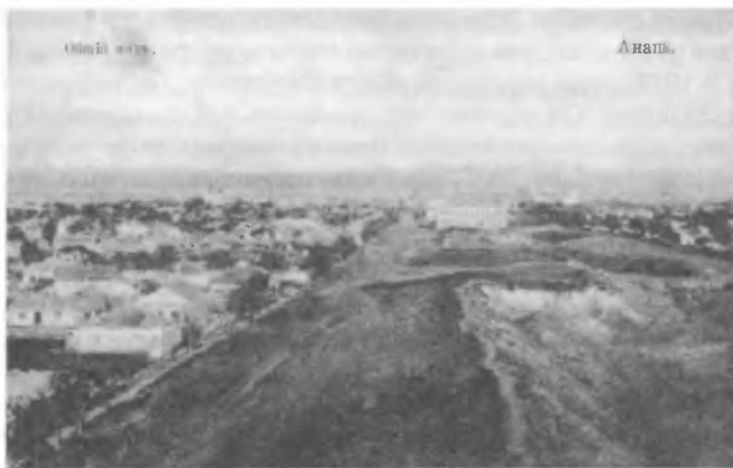
Общий вид. Крепостной вал.