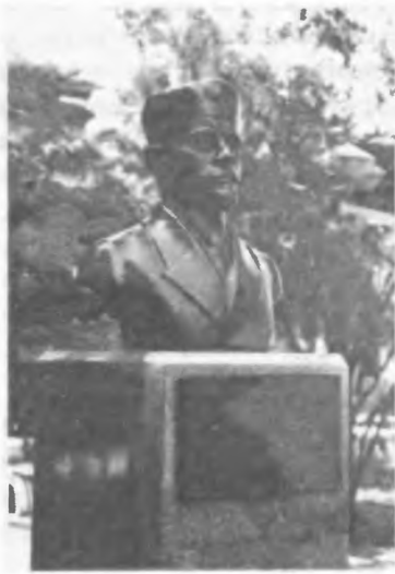
Памятник Будзинскому на территории сан. Анапа

Судьба разного рода открытий естественных лечебных богатств, сделанных русскими людьми, всем известна. В редких случаях удается таким людям добиться при жизни признания того, что после их смерти становится общим народным достоянием. Имя Будзинского многие десятилетия было основательно забыто. Теперь ему воздается должное.