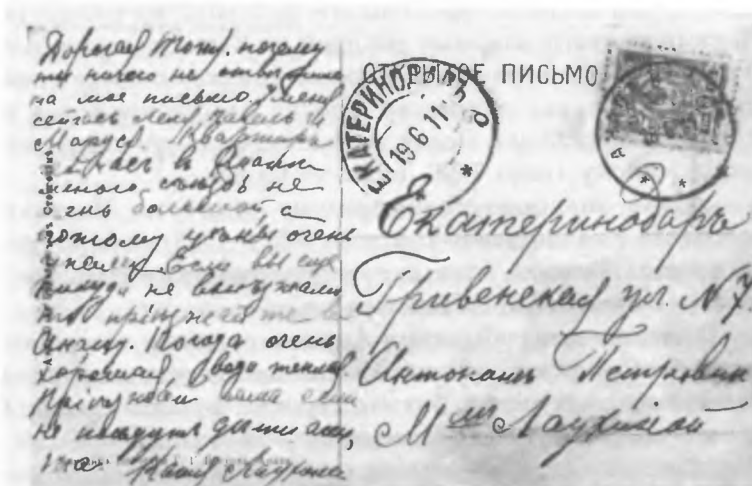
Открытка из Анапы.