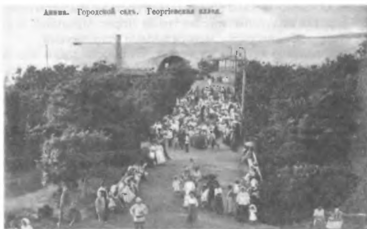
Городской сад. Георгиевская аллея.

Скучать гостям не приходится. Для них в саду есть новый великолепный курзал с обширным залом, библиотекой, читальней, сценой. В саду ежедневно играет музыка, проводятся тан-