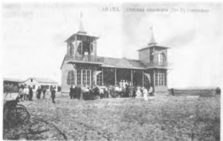
Детский санаторий «Бимлюк».