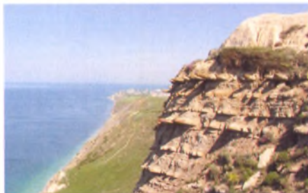
Живописный скалистый обрыв в районе Лысой горы

Несмотря на то, что в данном районе крайне неудобные подходы к морю, он представляет собой уникальное природное образование, идеально подходящее для создания парковых рекреационных зон курорта