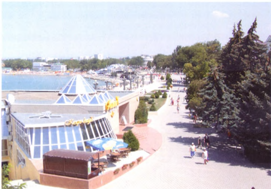
Вид на центральную набережную. Пример эффективного использования рекреационного ресурса курорта. Удачное сочетание рекреационной прогулочной зоны с объектами курортной инфраструктуры

Количество владельцев элитного жилья несоизмеримо меньше количества отдыхающих, которые смогли бы приехать к нам на курорт в течение года на эти тысячи квадратных метров, будь они номерами гостиниц или санаториев. Санатории и гостиницы создают реальные рабочие места на нашем курорте.