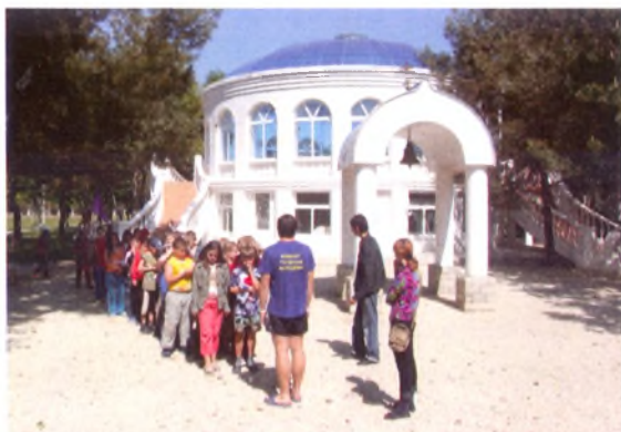
Бювет детского санаторного комплекса «Жемчужина России». ■

В Анапе функционируют 6 питьевых бюветов. На нескольких предприятиях ведется розлив минеральной воды (Анапская, Семигорская-1, Семигорская-6, Синдика). Проложено 6 маршрутов дозированной ходьбы. Но этого недостаточно.