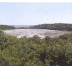
Крупный «вулкани- ческий» цирк дей- ствующего грязевого вулкана Шуго

Любопытными объектами являются дельфинарий с аттракционами и научно-экспериментальный биотехнологический комплекс Большой Утриш.