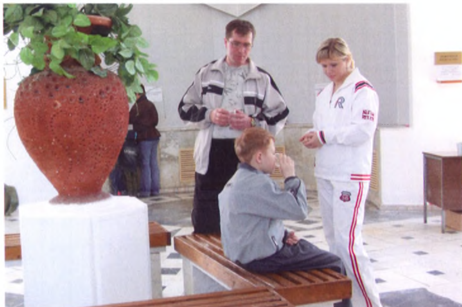
Прием отдыхающими минеральных вод в общекурортном городском бьюете

На сегодняшний день мы имеем все необходимое для создания «Бальнеологического курорта Анапа» и изменения исторически сложившегося представления об Анапе как о сезонном курорте. Для этого необходимо изменить общественное мнение и общественное отношение к нашему курорту. Это то, что на западе называется «паблик рилейшнз» (PR) . PR - (public relations) «Паблик рилейшнз» - при дословном переводе с английского означает «общественные отношения». PR - это продолжительные, планируемые усилия, которые направлены на создание и поддержку взаимопонимания и доброжелательных отношений между организацией и общественностью.