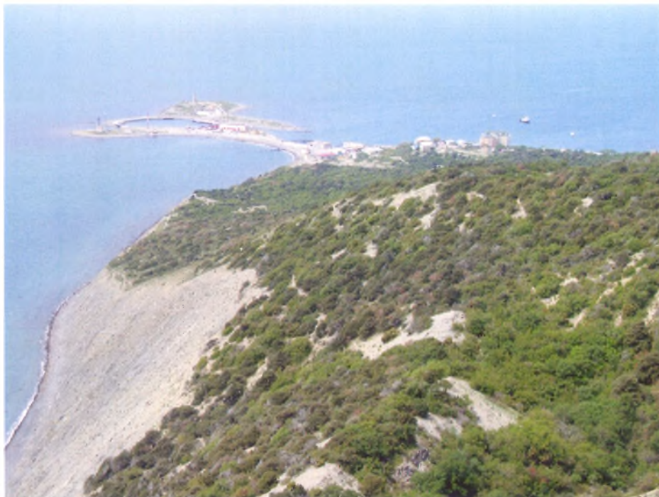
Полуостров Большой Утриш ■

Любопытными объектами являются дельфинарий с аттракционами и научно-экспериментальный биотехнологический комплекс Большой Утриш.