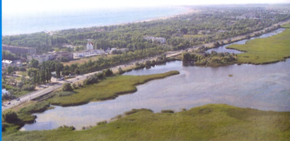
Вид на озеро Чембурка, Пионерский проспект и море ■

Морская вода способствует насыщению клеток и тканей кислородом, повышению активности ферментов, нормализации теплообмена и стимуляции гуморального транспорта. Она содержит большой процент растворенных веществ, в основном хлорида натрия, а также ионы калия, кальция, магния, гидрокарбонаты, сульфаты, фосфаты.