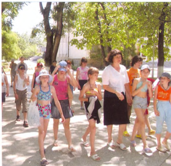
Маршрут дозированной ходьбы «Малая бухта» ■

Анапа сегодня разительно отличается от того курорта, который мы видели 3-4 года назад. Изменения, произошедшие в облике города и многих здравниц, значительно повысили привлекательность нашего курорта. Были восстановлены маршруты дозированной ходьбы. Но это экстенсивное развитие, т.е. внутри сложившейся концепции сезонного курорта и курорт становится еще более привлекательным в сезон, оставаясь по-прежнему не привлекательным в межсезонье (табл. 1).