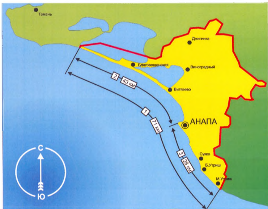
Схема 1. Границы Анапского района. Протяженность береговой линии

Начинаются песчаные пляжи от Анапской бухты и заканчиваются за Бугазским лиманом возле озера Соленого. Из песчаных пляжей на сегодняшний день эксплуатируются 13 км в районе Пионерского проспекта и 8 км частично используются, а частично планируется использовать в рамках инвестиционного туристско-рекреационного проекта «Новая Анапа» ст. Благовещенской. Оставшиеся 22 км песчаных пляжей приходятся на Витязевскую и Бугазскую косу отделяющую соответственно Витязевский и Бугазский лиман от Черного моря. Это довольно узкие (70-120 м) песчаные полосы суши.