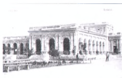
Анапа начала XX века. Курзал в районе Малой Бухты. Центр курортной жизни ■

Необходимо строительство современной и достаточно вместительной питьевой галереи, которая должна стать не только архитектурной достопримечательностью нашего курорта, но и центром бальнеологии. Такая галерея должна быть размещена в центре парковой зоны нашего курорта.