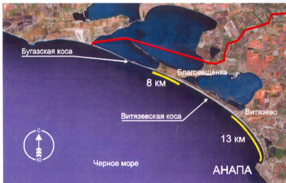
Схема 2. Используемые песчаные пляжи курорта Анапа

Галечные пляжи начинаются от морского порта Анапы и простираются на юго-восток от Анапы до поселка Малый Утриш (схема 3). Протяженность галечной береговой линии составляет 28 км. Из них на долю городских галечных пляжей приходится 3,7 км (от морпорта до так называемого района бойни). Далее вдоль отвесных скал тянется узкая каменная полоска в несколько метров. Следующий небольшой пляж (~ 400 м) располагается в месте впадения реки Шингари, эксплуатируется гостиничным комплексом «Шингари».