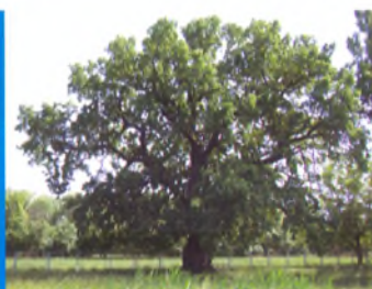
Семигорье. 600- летний дуб-испол- по преданию под ним отдыхал А.Суворов

Богатейшие целебные силы природы, достаточно развитая санаторно-оздоровительная сеть разновариантных учреждений позволяют отнести Анапу к уникальным и первостепенным курортам России. Но парадокс, Анапа в сознании россиян не ассоциируется с курортным водо- и грязелечением. Почему? Попробуем в этом разобраться ниже.