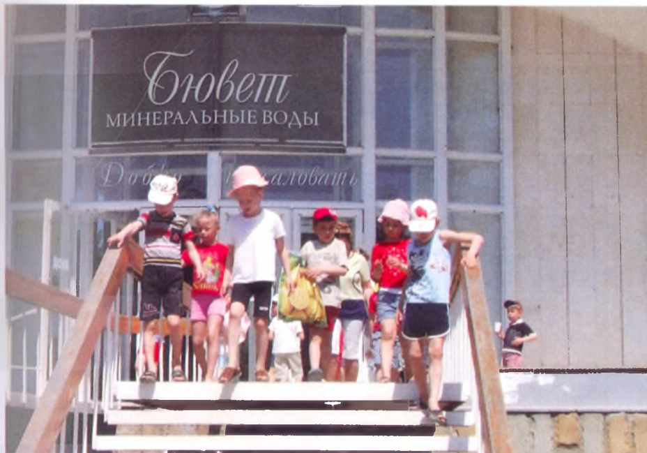
Дети на бальнеологическом лечении ■

Анапа бальнеологический курорт, имеющий великолепные минеральные воды и прекрасную медицинскую базу, работающий круглый год.