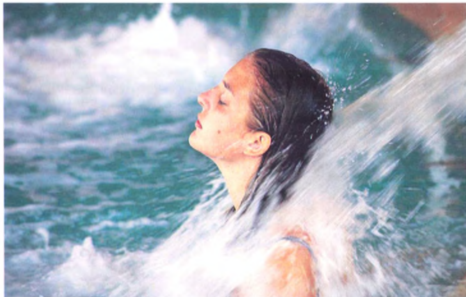
Морские купания в Анапе ■

Купание в море сопровождается массирующим и лимфостимулирующим действием волн, стерилизующим эффектом ультрафиолетового излучения солнца, химическим действием минеральных компонентов морской воды и содержащихся в ней микроэлементов, седативным шумовым эффектом прибоя.