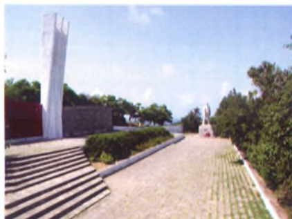
Памятник на месте последнего боя десантников под командованием капитана Д. Калинина