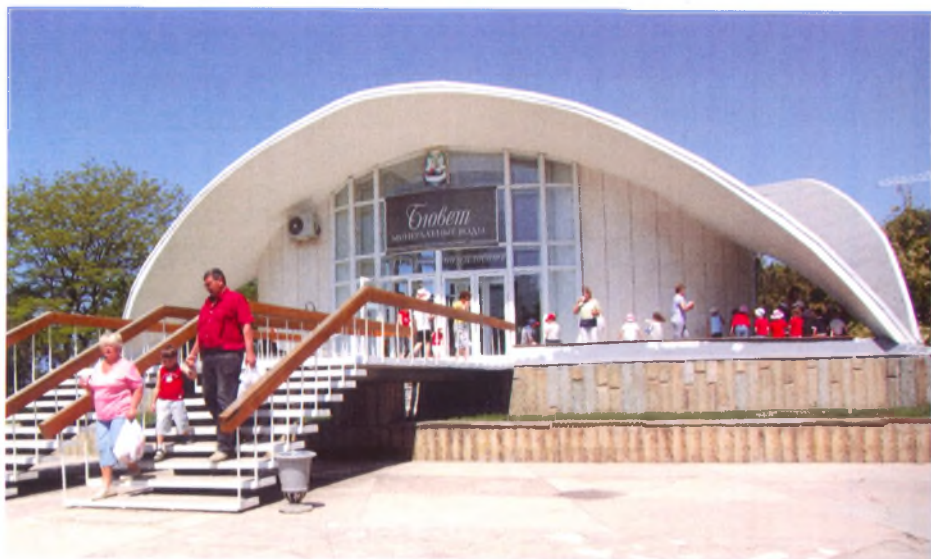
Общекурортный питьевой бювет. Вода «Анапская», «Семигорская-1», «Семигорская-6» ■

Питьевое лечение минеральными водами сочетается с диетическим питанием, климатотерапией, грязелечением, физиотерапией. Оно показано при заболеваниях органов пищеварения, почек и мочевых путей, нарушенном обмене веществ, хронических дерматозах.