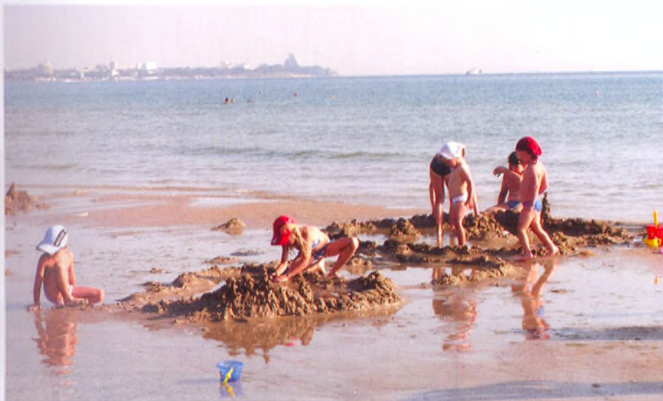
Райские условия отдыха и оздоровления для детей ■

Уникальные свойства курорта были отмечены многими видными учеными прошлого века. Но к сожалению, бальнеологические ресурсы нашего курорта оставались за скобками определения «курорт Анапа». О разнообразных минеральных водах Анапы многие отдыхающие, да и врачи даже нашего края, просто ничего не слышали.