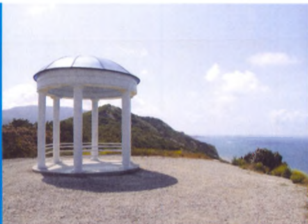
Смотровая площадка в районе перевала Муркин . Прямо за беседкой гора Солдатская, далее в море виден мыс Большой Утриш, слева вдали темнеет хребет Навагир

Нашему курорту жизненно необходим такой парк, как основной круглогодичный ресурс. Только благодаря созданию такого парка станет возможным полностью использовать природный потенциал нашего курорта. Парк станет гигантским лечебным кабинетом курорта, в котором круглый год будут отпускаться природно-климатические процедуры. Каждый отдыхающий сможет в полной мере ощутить целебную силу нашего уникального морского-степного-предгорного климата в сочетании с насыщенным аэроионами морским воздухом и ароматом целебных фитонцидов.