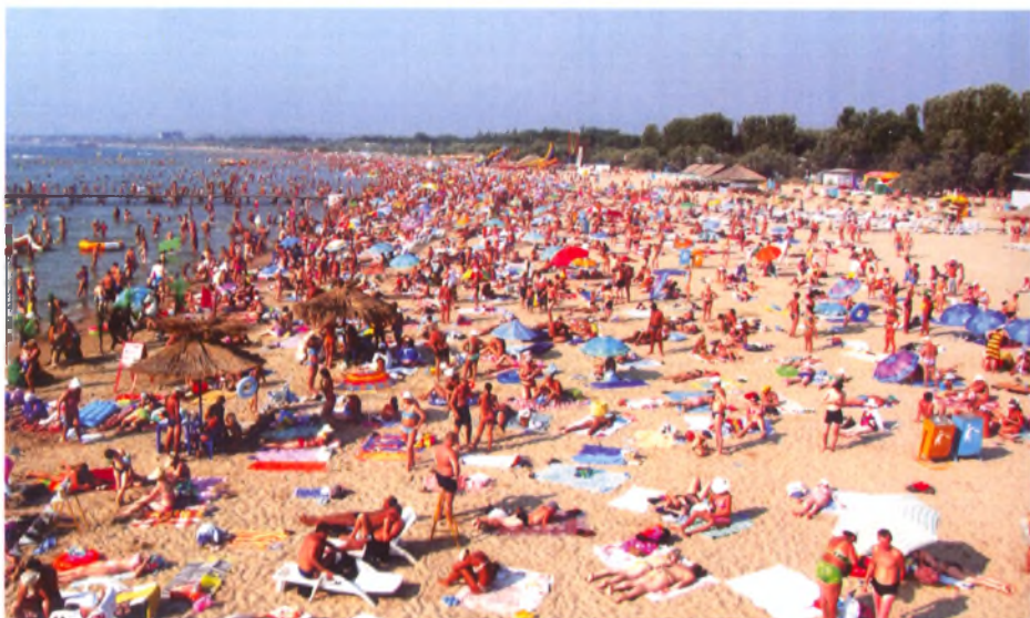
Анапский пляж - главный лечебный кабинет курорта

Климат следует оценивать как сильнодействующий фактор. Влияние климатопогодных факторов на организм человека является комплексным и многофакторным, причем оно постоянно меняется по интенсивности воздействия, по времени и по составу факторов. Каждый новый день на курорте не похож на предыдущий. Меняется температура воздуха, влажность, интенсивность солнечной инсоляции, направление и сила ветра, отсюда состав воздуха. Организму постоянно приходится формировать новые ответные компенсаторные реакции на климатические воздействие.