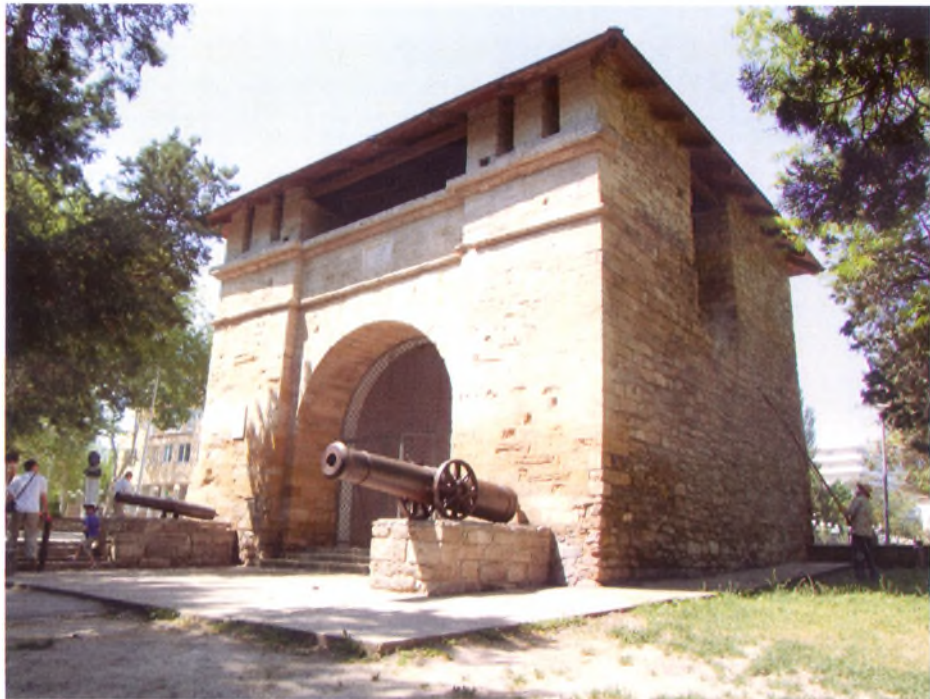
Главные Крепостные ворота, оставшиеся от турецкой крепости

С этой точки зрения Анапский регион представляет исключительный интерес, благодаря наличию крупных исторических памятников античности, периодов средневековья, русско-турецких войн, Отечественной войны 1941—1945 гг.