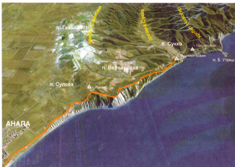
Район Лысой горы. Вид с высоты 11 000 м. Оранжевой линией отмечен маршрут от Анапы до Долины Сукко (протяженность 12 км). Возле этого маршрута можно проложить массу увлекательных маршрутов различной протяженностью

Но основой этого парка здоровья должна стать питьевая галерея, построенная в предгорье и являющаяся не только местом начала всех маршрутов, но и культурным, историческим, методическим и духовным центром. Именно духовным. В районе галереи в едином с ней комплексом нужно построить храм. А лучше несколько храмов основных мировых религий или единый храм с пределами по вероисповеданию. Для этого в богатой истории Анапы есть все основания. Все основные религии существовали на территории нашего курорта. Такой уникальный храм сам по себе станет объектом паломничества и позволит наполнить процесс оздоровления еще и глубоким духовным смыслом.