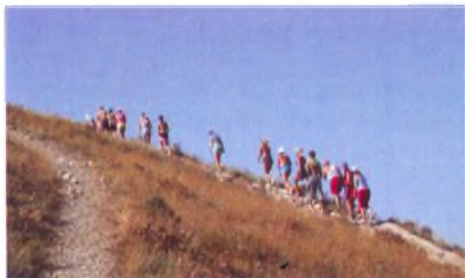
Экскурсия на гору Экономическую в долине Сукко