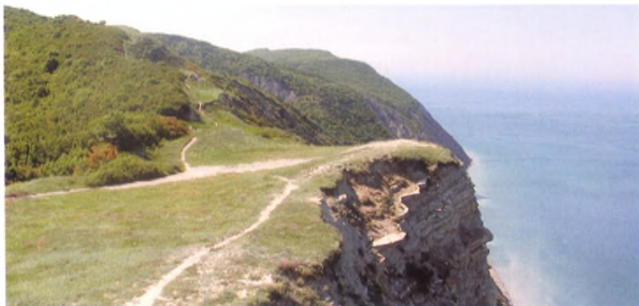
Район Лысой горы, сложный горный рельеф, разнообразная растительность и восхитительные виды создают все необходимые условия для организации разнообразных по сложности маршрутов терренкура с идеальными условиями аэротерапии, гелиотерапии, ландшафтотерапии

Проложенные у нас в городе и на Пионерском проспекте маршруты в строгом значении этого термина не являются терренкуром, а являются просто маршрутами дозированной ходьбы, т.к. проходят по ровной местности без подъемов и не дают полноценного лечебного и тренирующего эффекта.