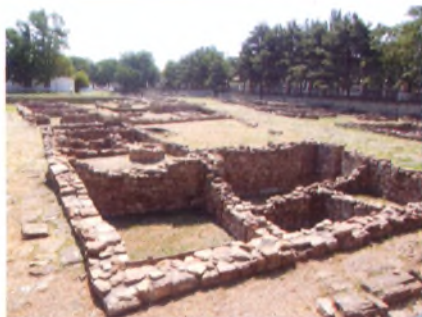
Анапский археологический музей. Улицы древнего города Горциппия. Таким археологическим богатством может похвастаться только Анапа

С этой точки зрения Анапский регион представляет исключительный интерес, благодаря наличию крупных исторических памятников античности, периодов средневековья, русско-турецких войн, Отечественной войны 1941—1945 гг.