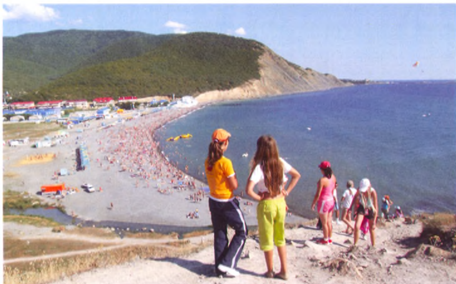
Галечный пляж долины Сукко и отроги хребта Навомир

Непосредственно от Анапы возвышаются горы хребта Самисам. Далее, от южного борта долины Сукко начинается хребет Навомир. Горы покрыты преимущественно лиственными лесами, но ближе к побережью встречаются участки реликтовых можжевельников и пихтовой сосны.