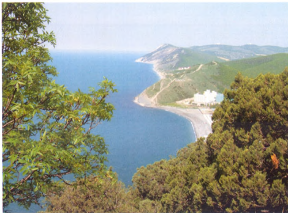
Вид на окрестности Анапы и Лысую гору с горы Солдатской в долине Сукко ■

Чистота морской воды позволила организовать в Анапе экспериментальные работы по выращиванию устриц, мидий и других представителей марикультуры.