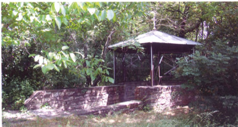
Каптаж минерального источника в Семигорье. До революции он назывался «Источник святого Владимира». Вода из этого источника применялась на курорте Анапа с 1905 года

Первый, Семигорский источник с минеральной водой был каптирован в 1905 году. Минеральная вода разливается в бутылки, газифицируется и реализуется для лечения в аптеках и магазинах Анапы и других местах