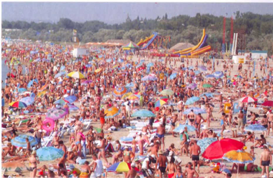
Центральный анапский пляж. Июль 2008 года

Чем же мы обладаем? Каковы наши рекреационные ресурсы? Каковы перспективы дальнейшего развития нашего курорта?