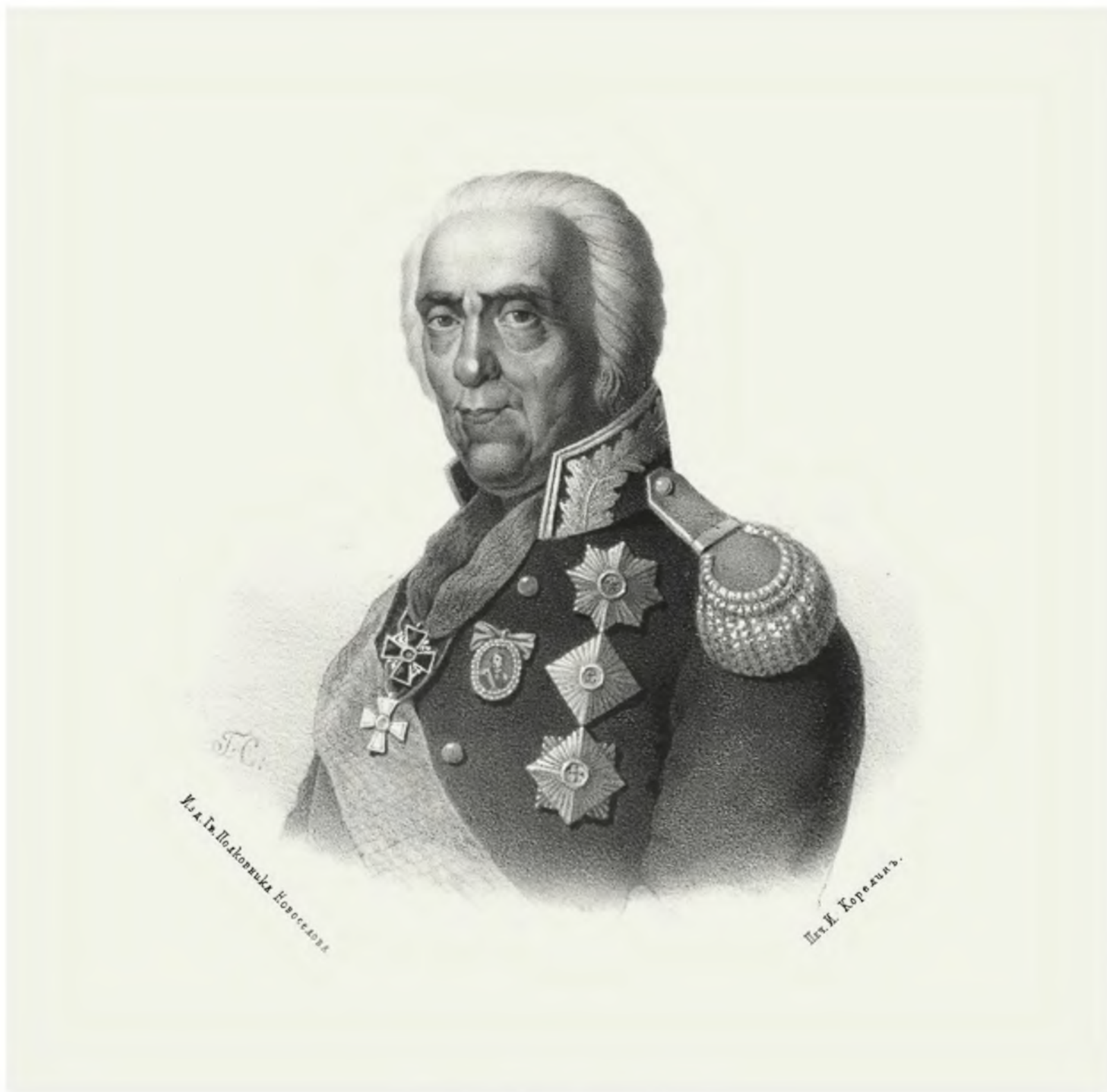
Графъ Иванъ Васильевичъ ГУДОВИЧЪ.